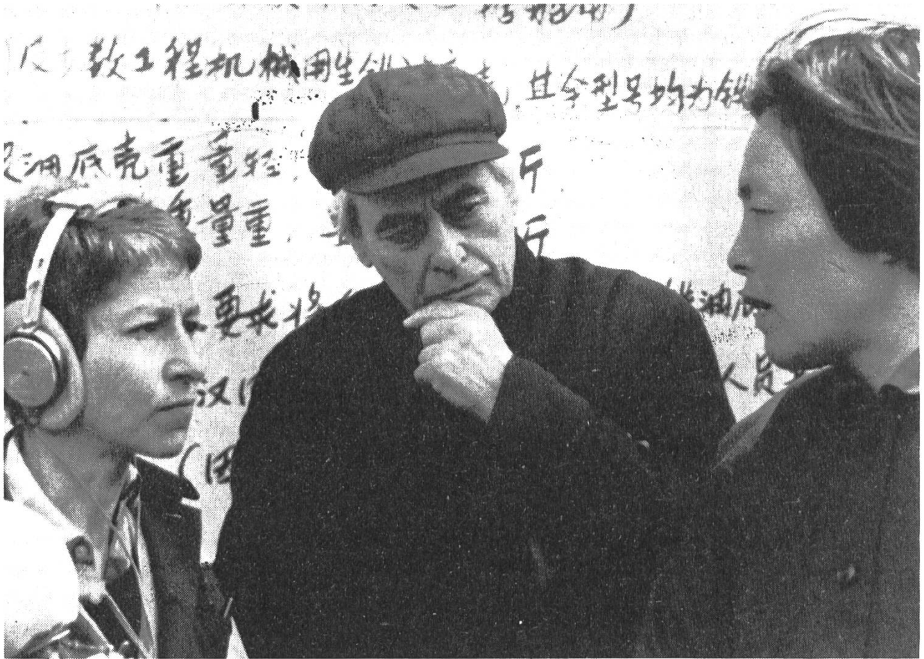
Marceline Loridan und Joris Ivens im Gespräch mit einer Chinesin.

meinsam Lösungen zu finden. Egoismus findet man in den Filmen von Ivens und Loridan nicht.