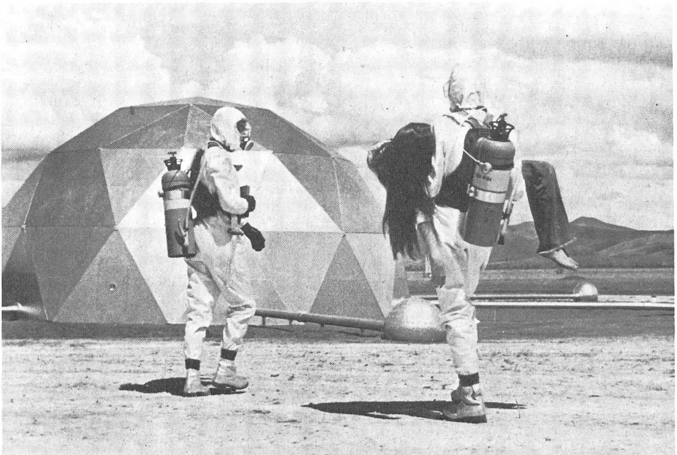
Aus «Phase IV» von Saul Bass (Grossbritannien 1973).

Skepsis gegenüber der Machbarkeit aller Dinge und einer unüberschaubar werdenden Dimension der Technik sowie die Sehnsucht nach dem Mysterium, die sich mitunter auch ganz einfach als Verlangen nach Romantik in einer durchrationalisierten, rein funktionalen Welt äussert, prägten das Genre nicht immer. Science-Fiction, die in ihrer heutigen Form auf Jules Verne zurückgeht, ist eng mit der Entwicklung der Technik und dem Glauben an die Veränderbarkeit der Welt durch sie verbunden. «Alles, was ein Mensch ausdenken kann, wird ein anderer Mensch realisieren können.» Diese Devise Vernes hat seine phantastischen Romane geprägt. Sie sind von jener unerschütterlichen Fortschrittsgläubigkeit getragen, die aus der Philosophie der Aufklärung genährt wurde. Nach ihr hat der Mensch die Möglichkeit, seine Umgebung, ja auch sein Schicksal zu gestalten, wenn immer er nur will. Dass diese bedingungslose Fortschrittsgläubigkeit einem Missbehagen, zumindest aber einer kritischen Distanz gewichen ist, hat zwei Ursachen: Die Erfahrung im Um-