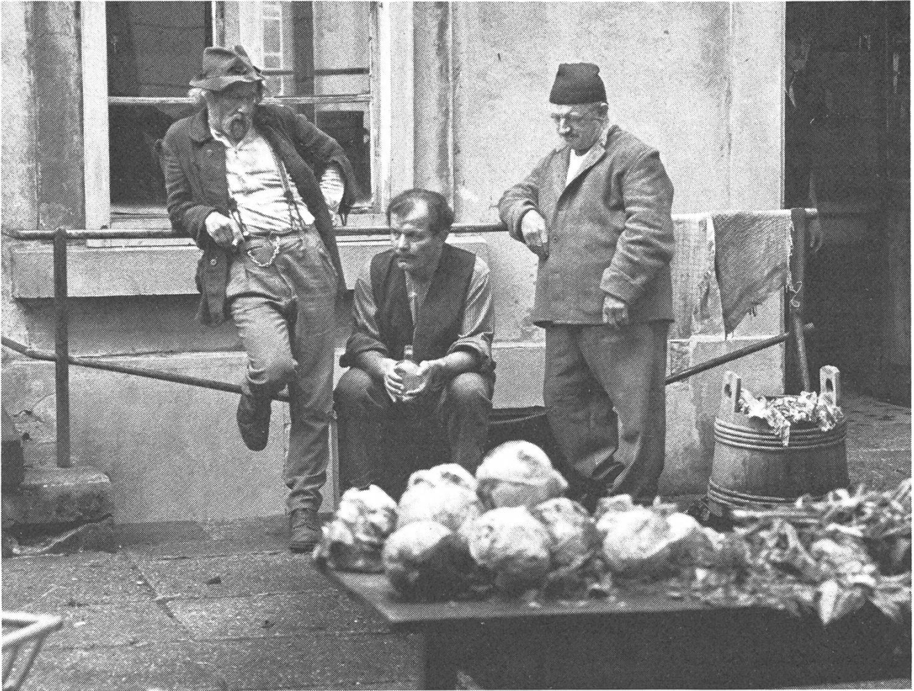
Das Elend der Armenhäuser...

fand sich im zerfurchten Gesicht, das Güte ausstrahlte, und in der behäbig-langsamem Dialektsprache Heinrich Gretlers wieder. Die Entsprechung ging so weit, dass hierzulande die Figur des Wachtmeisters Studers mit Gretler automatisch gleichgesetzt wurde. Nicht verwunderlich, dass der Verlag der Arche in Zürich, der zu Beginn der siebziger Jahre das Werk Glasers neu herausgab, für die Titelgraphik mehrmals die Umriss Gretlers als Studer verwendete.