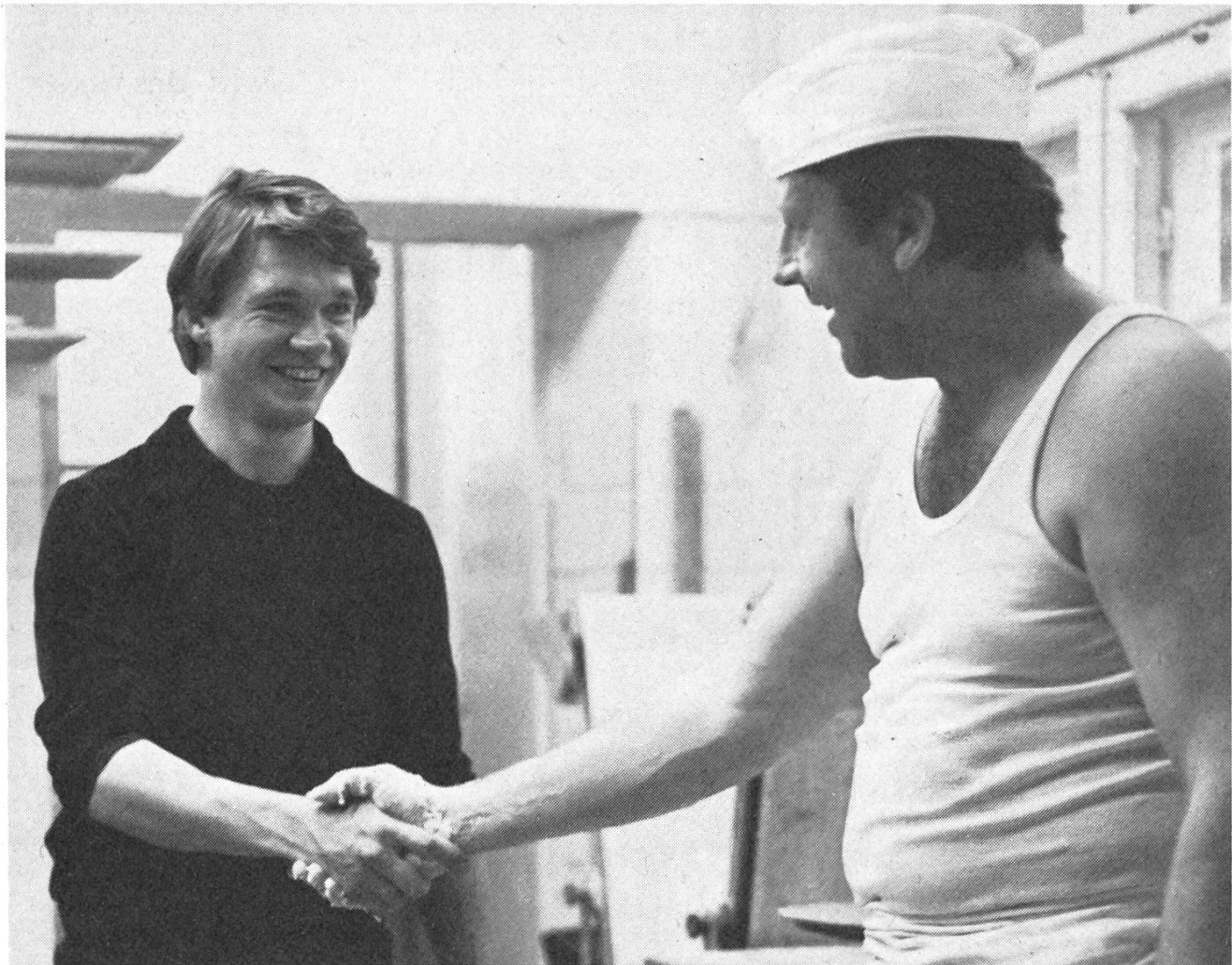
Emigration als letzter Ausweg: der talentierte Schweizer Regisseur Erwin Keusch hat seinen Spielfilm «Das Brot des Bäckers» in der Bundesrepublik gedreht.

ger Jahre, als beschlossen wurde, eine Filmgesetzgebung auf die Beine zu stellen. Jetzt haben wir diese Filmgesetzgebung. Sie würde an sich durchaus funktionieren, sofern die erforderlichen Mittel vorhanden wären. Meiner Meinung nach hat sich die unmittelbare Sorge auf die finanziellen Aspekte zu beschränken.»