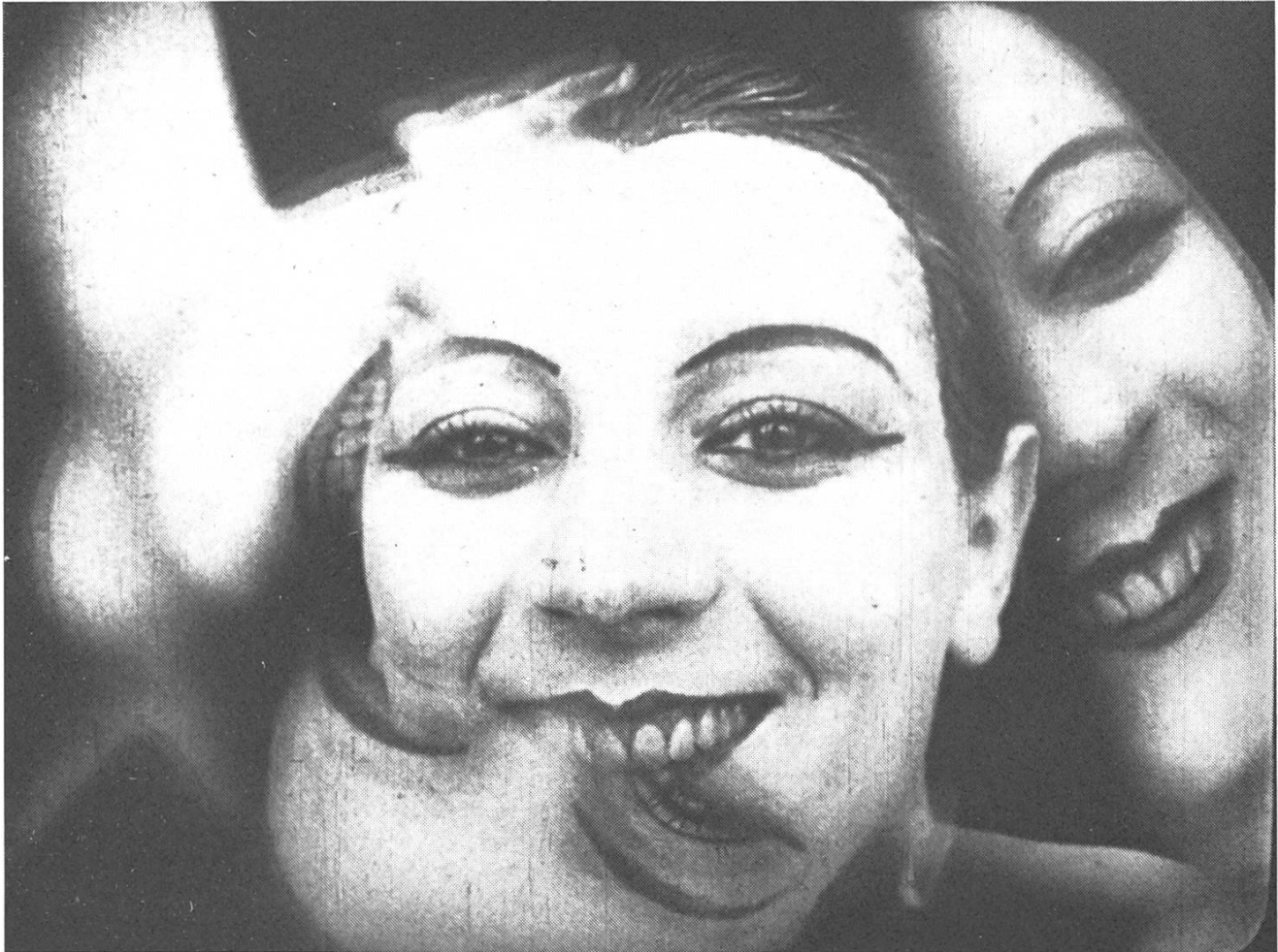
«Le Ballet Mécanique» (1923) von Fernand Léger.

neue Elemente enthalten sollte. Nein sagen zu solchen Produktionsbedingungen? Zweifellos... und inzwischen verhungert der Filmemacher.