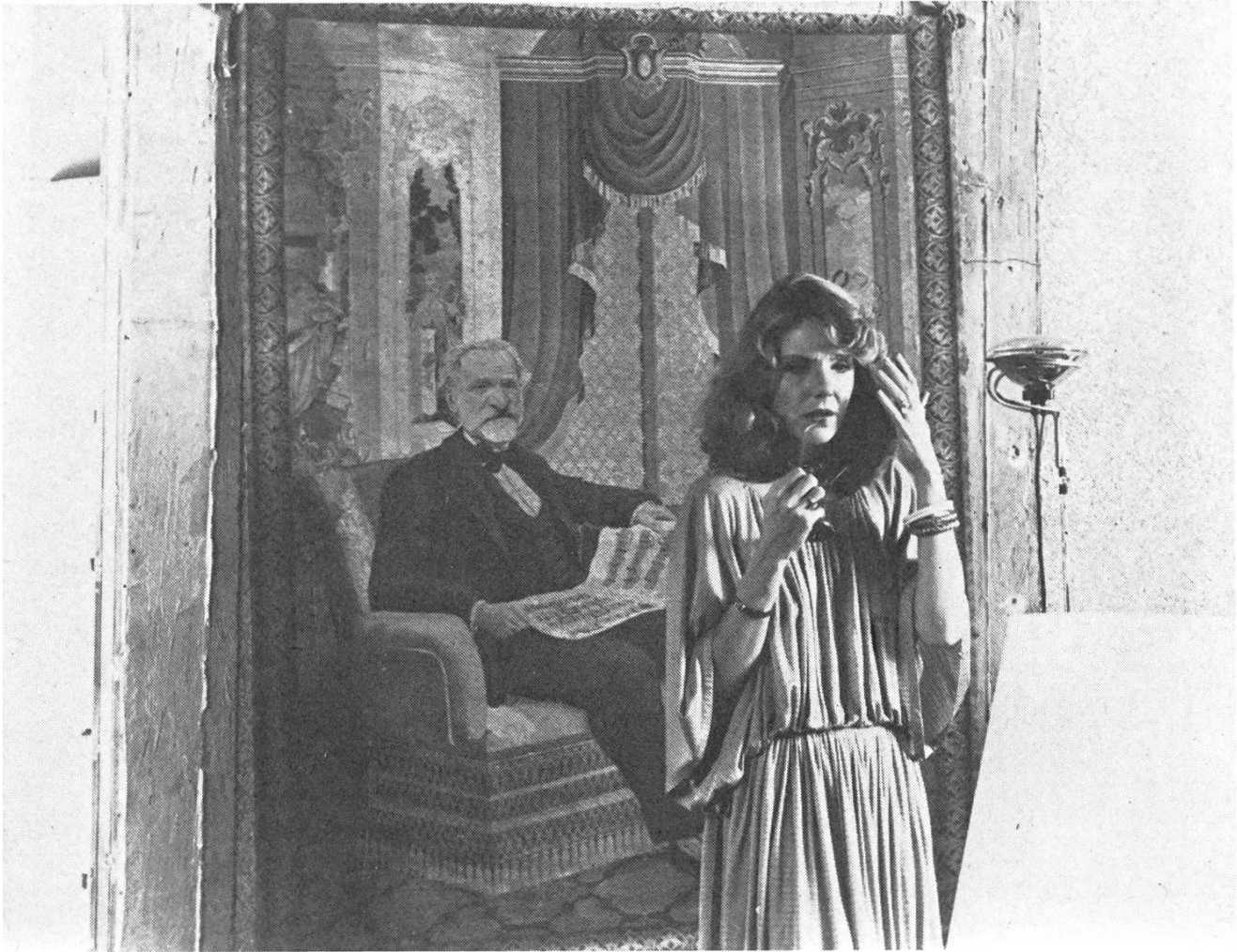
Über Verdis Opern den eigenen Sohn vernachlässigt. Jill Clayburgh in Bernardo Bertoluccis «La luna».

schaffenden, die in den USA arbeiten. Das Thema ihres Films ist das Leben ihrer Landsleute im amerikanischen Exil. Seit zehn Jahren lebt der Kubaner Robert mit seiner Frau und Tochter in New York. Er fristet als Hauswart ein kärgliches Dasein, leidet unter der Kälte und der Anonymität New Yorks, er fühlt sich einsam, gedemütigt und hat Heimweh. Er weigert sich, Englisch zu lernen, sich anzupassen und hofft, eines Tages in wärmere, südlichere Gefilde heimkehren zu können. Der Film besteht aus einer Folge von leichthändig zusammengefügt Szenen, die Einblick geben in Roberts Familienleben, seine Arbeit und die Beziehungen zu seinen Freunden. Das ist manchmal umwerfend tragikomisch und gibt zugleich einen treffenden Begriff vom Emigrantenschicksal, das heute in aller Welt Millionen erleiden.