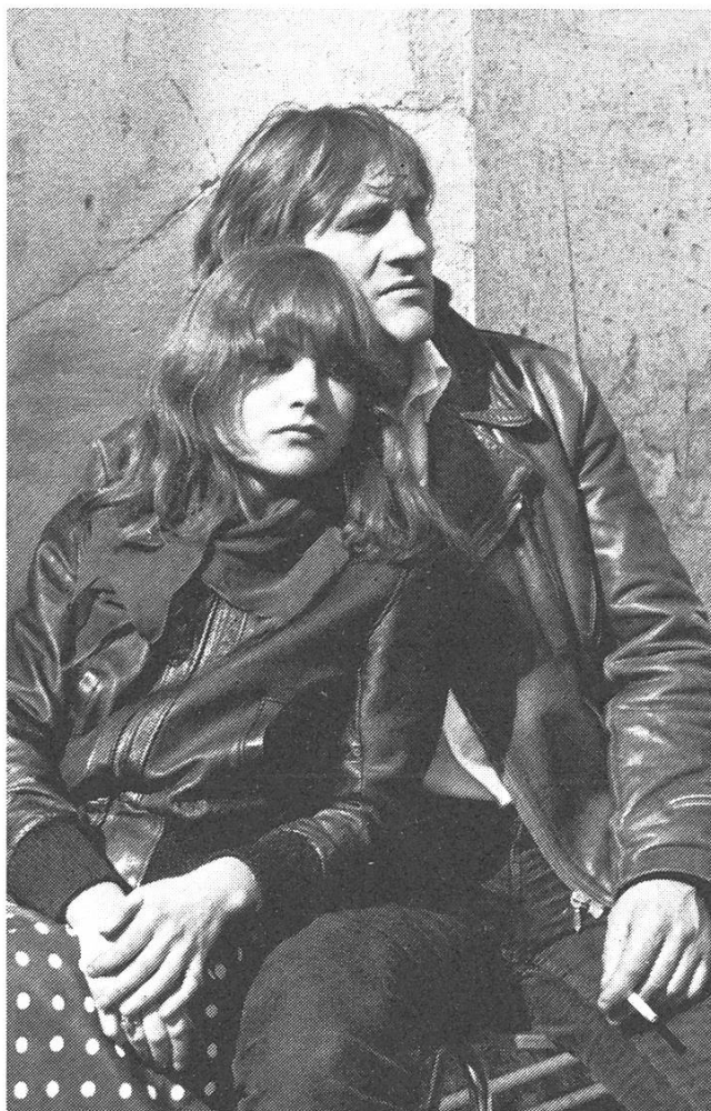
Durch Liebe vereint, durch die Klasse getrennt: Isabelle Huppert und Gérard Depardieu.

Film in der Absicht seiner Autoren jenes Motiv des «nous ne vieillirons pas ensemble» variieren, indem für den Betrachter einsehbar werden sollte, dass der Beziehung zwischen Jenny und Loulou keine Zukunft beschieden sein kann. Die Schlussesequenz, in der die beiden eng umschlungen davongehen, wird jedoch wohl von jedem Betrachter als starkes Sinnbild der Hoffnung empfunden werden. Dort hingegen, wo der Film seine Geschichte gleichsam aus sich selbst heraus entwickelt, ist er von einer Frische und unmittelbar überzeugenden Kraft, wie man sie nur sehr selten zu sehen bekommt.