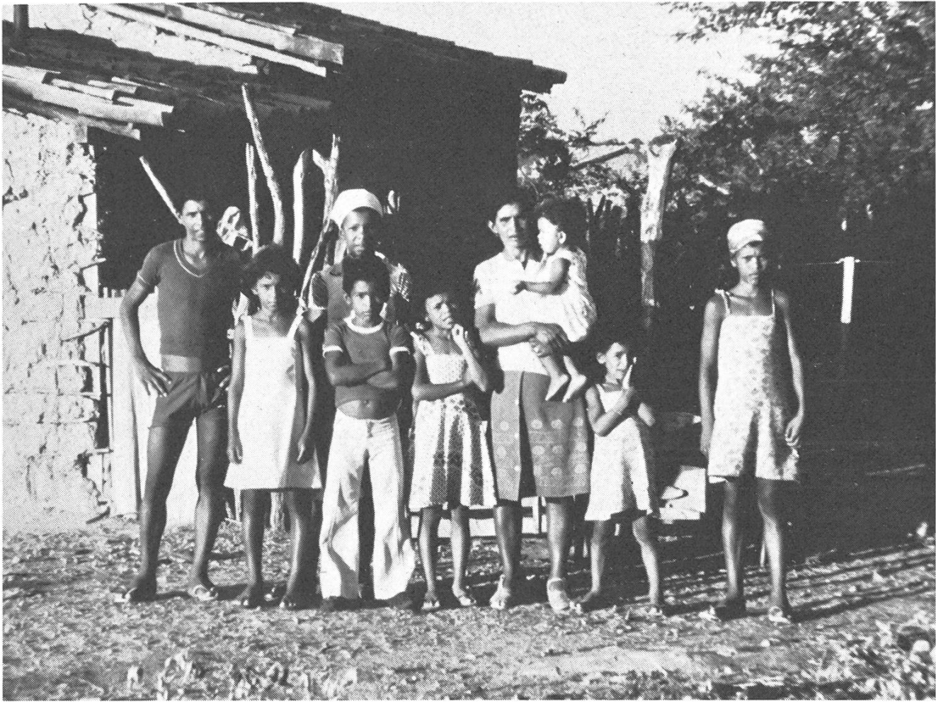
An den Bedürfnissen der Menschen vorbei-geplant: Familie aus dem Sobradinhogebiet.