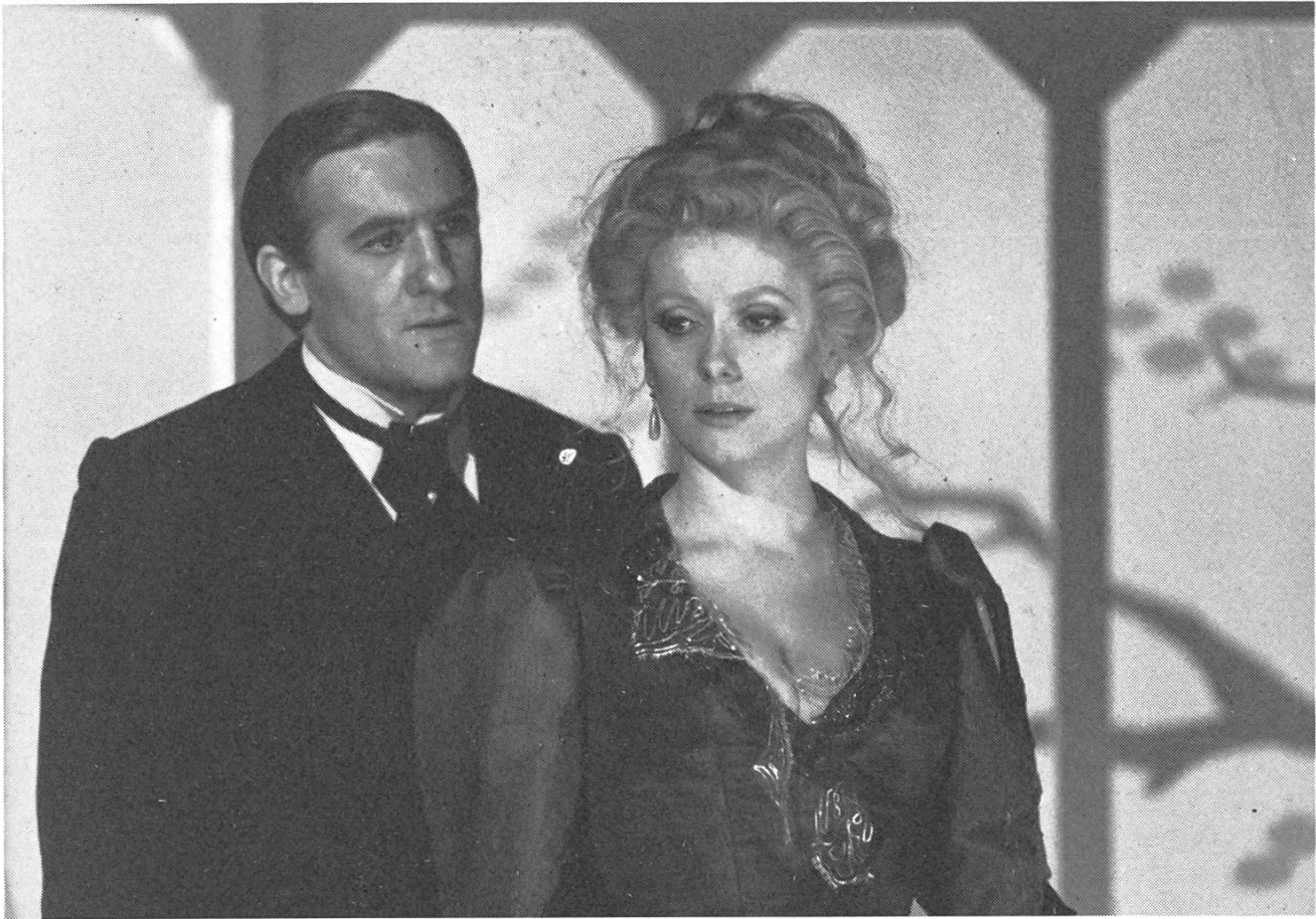
Versteckspiel auf der Bühne und im Leben (Gérard Depardieu und Catherine Deneuve).

nierung. Die Premiere wird zum Erfolg, aber der Kritiker und Kollaborateur Daxiat schreibt nicht nur einen antisemitisch eingefärbten Verriss, sondern droht unverblümt politische Massnahmen an. Granger, der ebenfalls ein Doppelleben geführt hat, zieht die Konsequenzen und geht endgültig zur Résistance über. Zuvor freilich gestehen er und Marion sich ihre Liebe, die bisher das beiderseitige Maskenspiel nicht zu überwinden vermochte. Nach der Befreiung begegnet man allen dreien wieder: Steiner, seine Frau und Granger nehmen gemeinsam den Beifall für eine neue Inszenierung entgegen.