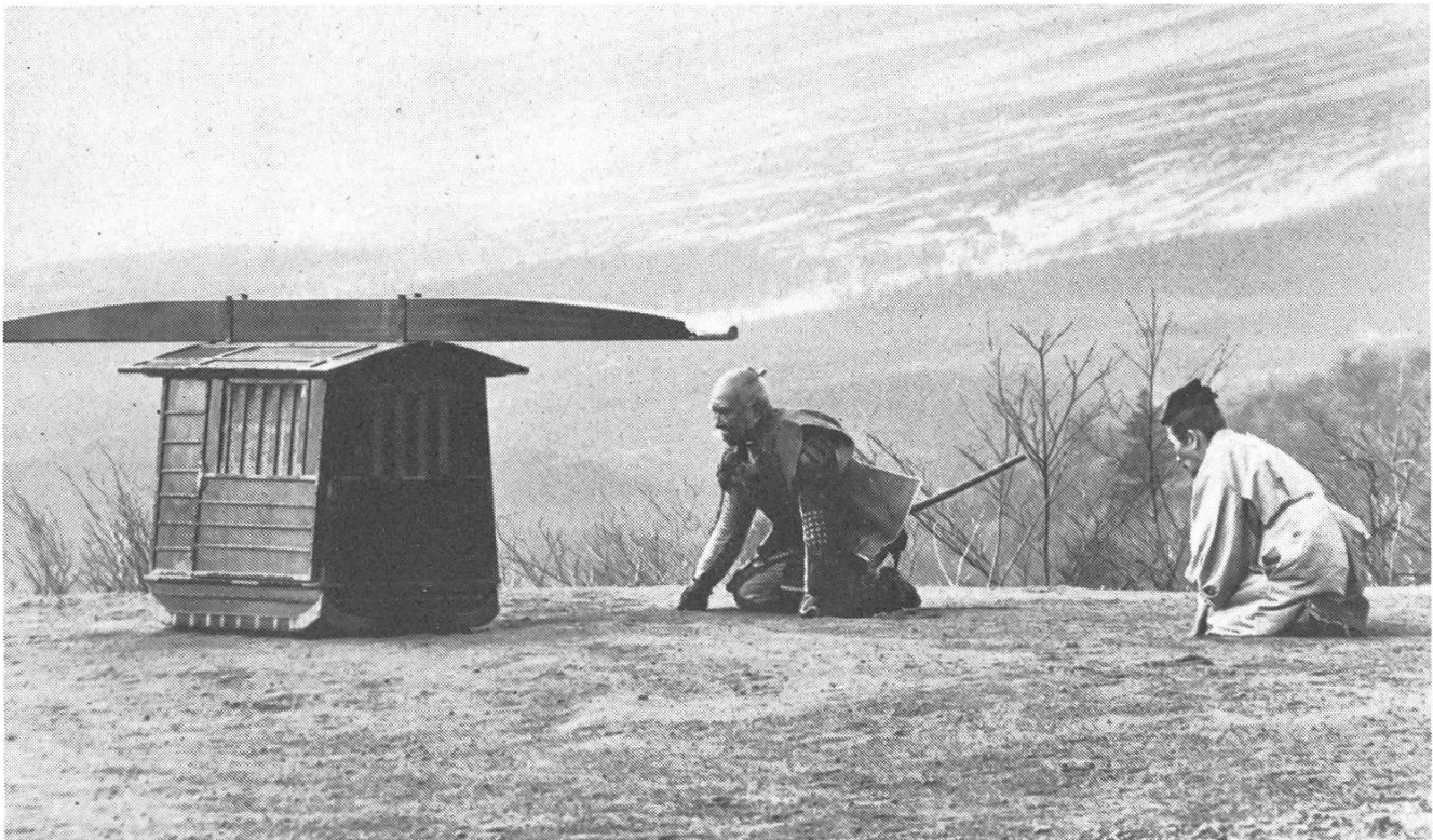
Ritual einer vergangenen Zeit: Ein General vor Shingens Sänfte.

Land gebracht hat – wird Katsuyoris «Wind» (Reiterei), «Wald» (Infanterie) und «Feuer» (Bogenschützen) vernichtet. Der Untergang des Clans ist besiegelt. Auch Kagemusha wird von einer Kugel getroffen, er greift nach der im Fluss treibenden Fahne Shingens und wird vom Wasser davongetragen. Kurosawa erzählt diese Geschichte mit der Souveränität eines grossen Epikers. Gewaltige Bildkraft und optische Wucht, strenge Bildkompositionen und ein ungeheuer straffer Rhythmus schlagen den Zuschauer in Bann. Wie schon in seinen früheren Meisterwerken stellt Kurosawa Explosionen von expressiver, rauschhafter Violenz und Bewegung unmittelbar neben Szenen von verhaltener Ruhe, asketischer Statik und ausgewogener Balance, «innerhalb des japanischen Films die präziseste Entsprechung filmischer Form für jenen tiefen Antagonismus von Aggression und Verinnerlichung, der Japans gesamte Geschichte und Kultur durchherrscht» (Harry Tomicek). Bereits zu Beginn des Films wird dieses Prinzip des Gegensatzes angewendet: In minutenlang starrer Einstellung wird das Gespräch zwi-