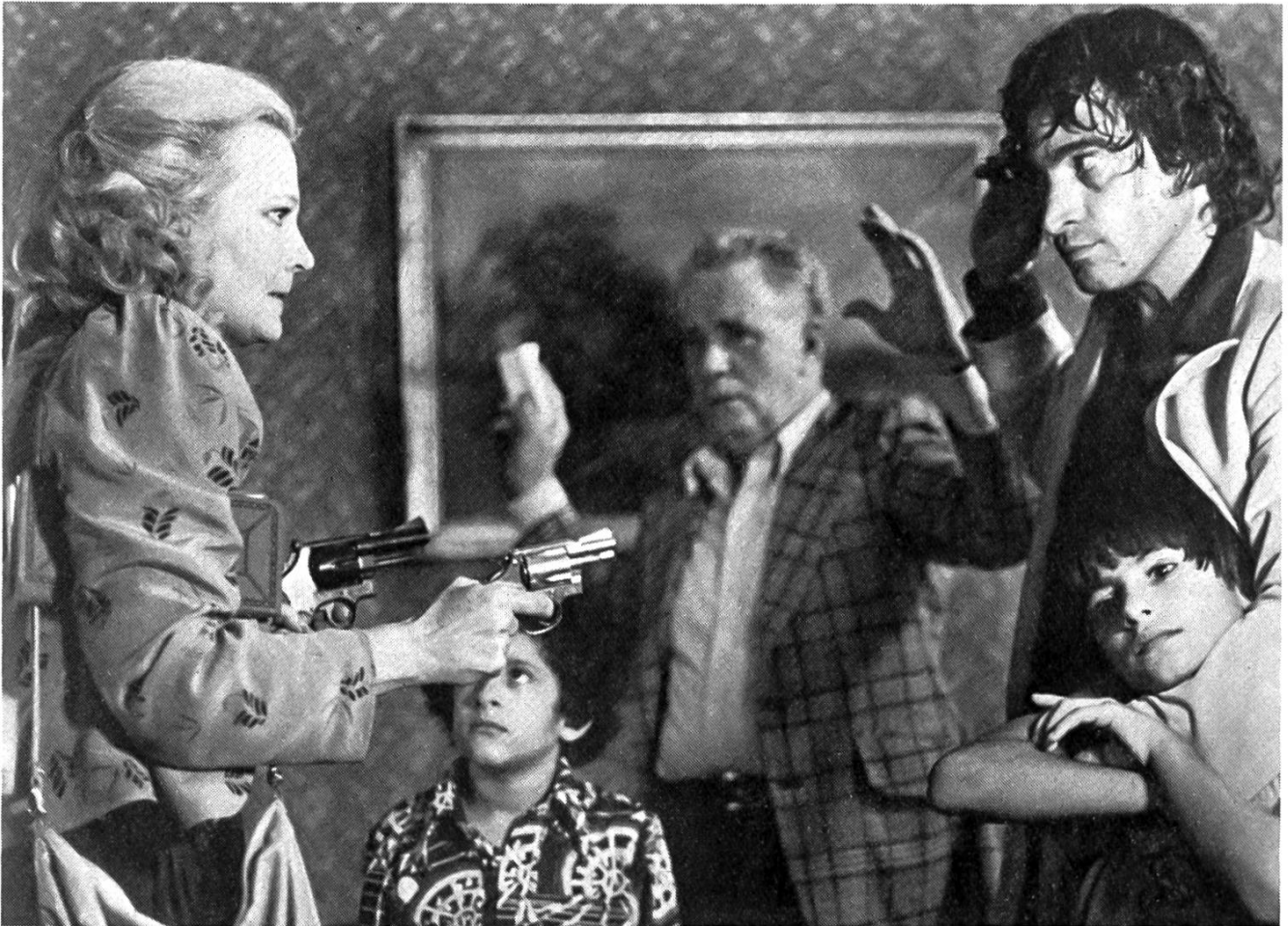
Gena Rowlands (links) als Gloria in John Cassavetes glänzend inszeniertem Film.

gibt der Vater ein kleines schwarzes Buch mit Aufzeichnungen über die Transaktionen der Bande. Er solle gut darauf aufpassen, denn darin stünde alles, was er vom Leben wisse. Kaum ist Gloria mit Phil in ihrer Wohnung zurück, ist eine Explosion zu hören. Gloria weiss, dass die Familie des Puertoricaners nicht mehr existiert. Sie ist allein mit ihrem Kater und dem feindseligen Jungen, mit dem sie nichts anzufangen weiss.