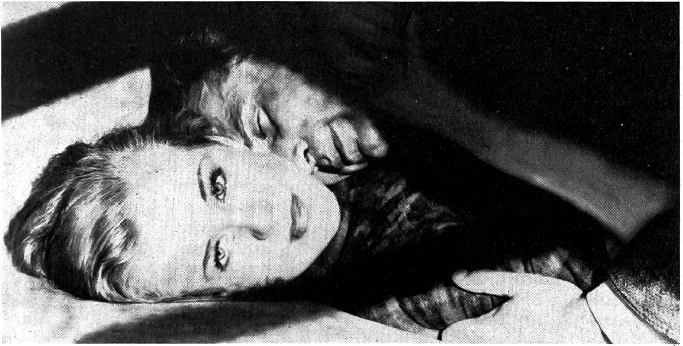
Ernst Wilhelm Borchert und Hildegard Knef in «Die Mörder sind unter uns».

richten, antwortet der Chirurg: «Nein, Susanne, aber wir haben die Pflicht, Anklage zu erheben, Sühne zu fordern im Auftrag von Millionen hingemordeten Menschen!»