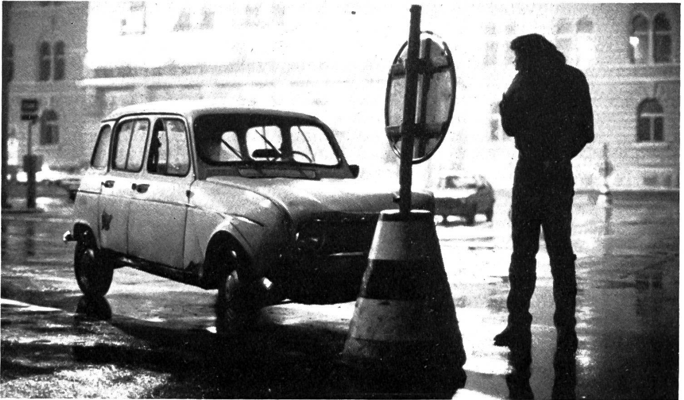
Amoklauf eines Spiessers.

lässt er das Studio, steigt in den Wagen und fährt Amok: einen kleinen zwar nur, einen, der sich in den gesellschaftlich gerade noch tolerierten Grenzen hält. Auch im Akt der Selbsterstörung vermag Max keine Grenzen zu sprengen. So ein Spiesser!