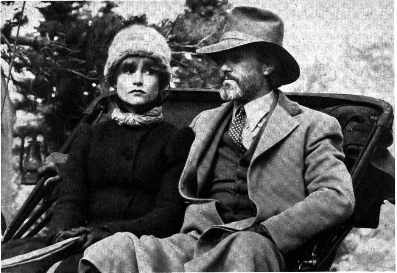
Isabelle Huppert und Kris Kristofferson.

Personen und ihrem Schicksal identisch. Cimino hat ihre Rollen verändert, sie seiner epischen Parabel über Legalität und Moral, Recht und Gesetz und wie die Mächtigen es zu ihren Gunsten zurechtbeugen, einverleibt.