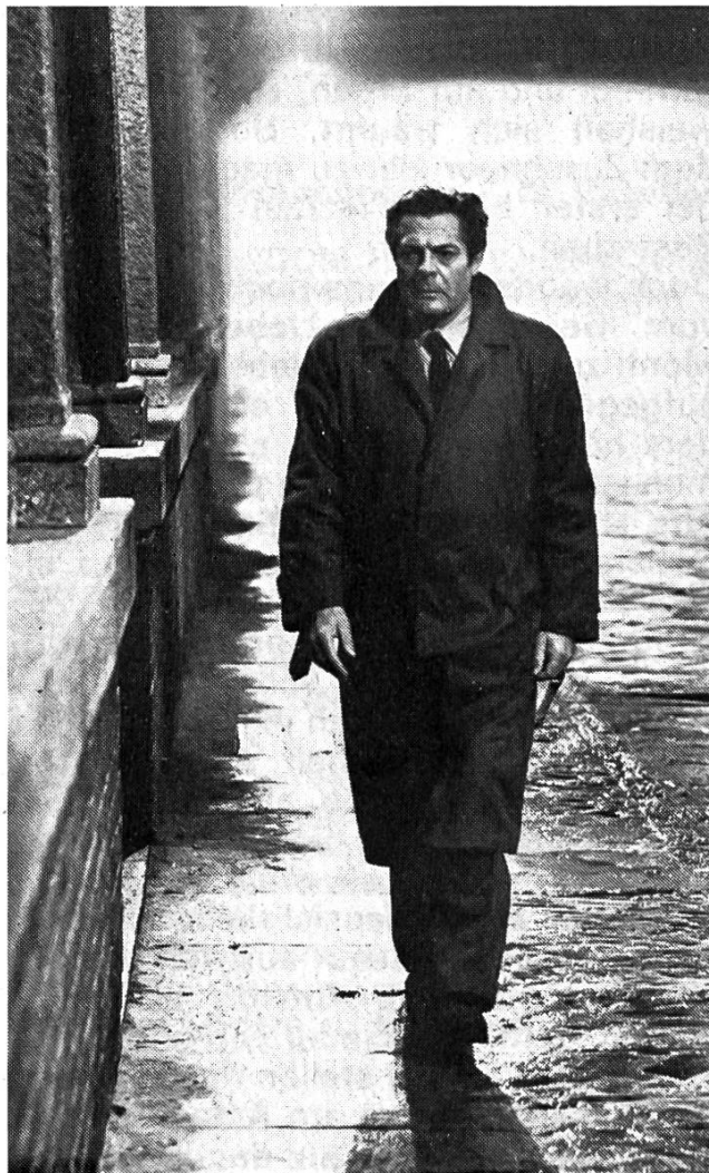
Nino Monti (Marcello Mastroianni), das nichtgelebte Leben, die aufgegebenen Träume holen ihn ein.

Der Zuschauer der diese ganze Mär durch die Optik des Protagonisten, d.h. Identifikationsfigur, sieht, beginnt langsam zu ahnen, dass das Gespenst der Liebe nicht nur zum Lieben aufgetaucht ist. Nach den Erklärungen Annas anlässlich der Bootsfahrt auf dem Tessin und dem Auffinden der Leiche des Neffen lässt sich der «Sachverhalt» aussprechen. In zwei Gestalten ist Anna aus dem Schattenreich zu den Lebenden zurückgekehrt: als Racheengel nämlich (um den Neffen und seine Tante zu töten) und als Liebesengel. Dieses uralte dramaturgische Grundschema vom Typ