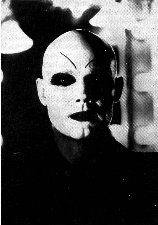
Klaus Maria Brandauer in der Rolle des ruchlos brillanten, zynisch rücksichtslosen Karrieremachers.

bei den Frauen. Und Erfolg ist für Höfgens die Droge, die ihm die Illusion verschafft, auch geliebt zu werden. Dabei weiss er im Innern, dass niemand ihn lieben kann, da er seine wirklichen Freunde aus Feigheit längst verraten hat: Juliette (Karin Boyd), die farbige Freundin, lässt er widerstandslos durch die Polizei nach Paris schaffen; für Otto Ulrichs, den Jugendfreund aus der Zeit des politischen Kabarets, riskiert er beim «General» zwar einen Anschiss, aber nicht mehr. Klaus Mann hat in seinem Roman Höfgens eine Person gelassen, die ihm eine liebevolle Zuneigung bewahrt: Frau Bella, die eigene Mutter. Bei Szabó spielt Höfgens Mutter keine Rolle mehr: Der Ungar verweigert seinem Protagonisten diese letzte psychologische Bindung an die Realität und lässt ihn damit vollends zum Typus werden – nicht nur zum Typus des Karrieristen, sondern auch zu demjenigen des ichschwachen Narzissten, der sich sel-