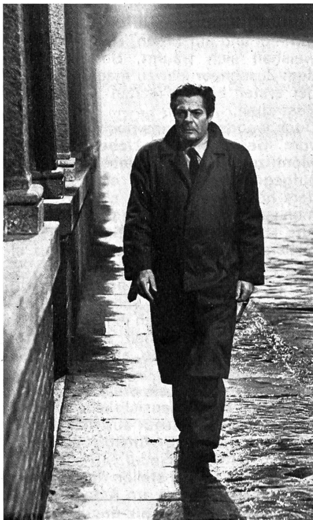
Nino Monti (Marcello Mastroianni), das nichtgelebte Leben, die aufgegebenen Träume holen ihn ein.

Der Zuschauer der diese ganze Mär durch die Optik des Protagonisten, d.h. Identifikationsfigur, sieht, beginnt langsam zu ahnen, dass das Gespenst der Liebe nicht nur zum Lieben aufgetaucht ist. Nach den Erklärungen Annas anlässlich der Bootsfahrt auf dem Tessin und dem Auffinden der Leiche des Neffen lässt sich der «Sachverhalt» aussprechen. In zwei Gestalten ist Anna aus dem Schattenreich zu den Lebenden zurückgekehrt: als Racheengel nämlich (um den Neffen und seine Tante zu töten) und als Liebesengel. Dieses uralte dramaturgische Grundschema vom Typ