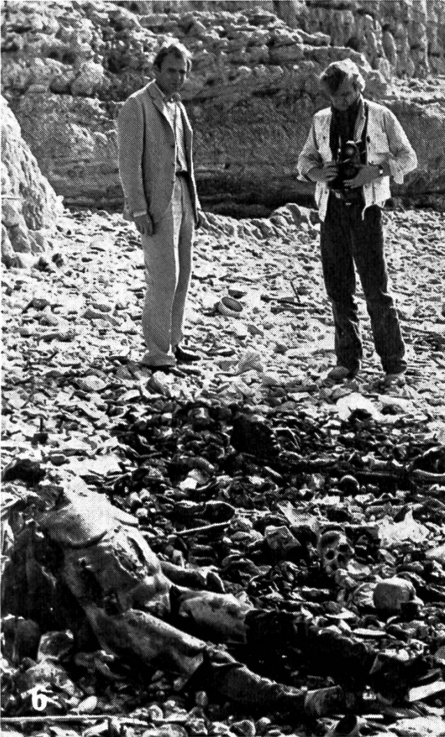
Laschens (Bruno Ganz) und Hoffmans (Jerzy Skolimowoski) Aufgabe ist es, Tod und Entsetzen des Krieges fachgerecht zu vermarkten.

vor allem von französischen Filmemachern immer wieder geleistet worden ist – und was im deutschen, auch im neuern deutschen Film noch immer leicht unter den Verdacht oder doch den Vorbehalt des Spielerischen, des Experimentellen, Unernstes gerät. Schlöndorff hat in seinem neuen Film einen eigenen, einen ungewöhnlichen, kaum repetierbaren und in gewissem Sinn heroischen Weg begangen. Er hat einerseits konsequent den Film am tatsächlichen Schauplatz, in Beirut, im weiter sich hinfrassenden libanesischen Bürgerkrieg gedreht. Und er hat gleichzeitig ebenso konsequent den Film mit offenen Karten als Film inszeniert, also keine Vermengungen von Dokumentar- und Spielszenen zugelassen.