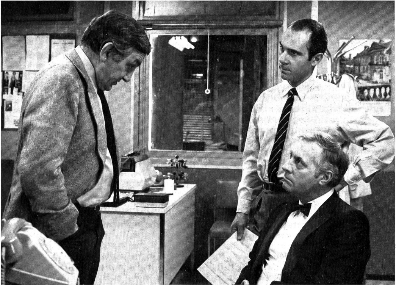
In Haft auf Zusehen: Lino Ventura, Guy Marchand, Michel Serrault.

schen Kraft weniger nach dem «Whodunit?» zielt als nach dem Wesen von Sein und Schein, von Urteilen und Vorurteilen, von Norm und Abweichungen, von Schuld und Unschuld, die sich nicht nach rational erfassbaren Indizien festlegen lassen. Der Film nimmt auch die Zuschauer in eine «garde à vue», eine Haft auf Zusehen hin, befragt sie nach ihrem Urteilsvermögen, nach ihrer Fähigkeit und ihrem Willen zur Beobachtung und wird sie des öftern des Vorurteils überführen, der gedankenlosen Übernahme fixfertiger «Fakten» und Interpretationen, der Autoritätsgläubigkeit und der Parteinahme für die stärkeren. Wir schauen der Konfrontation dieser beiden gegensätzlichen Männern zu und lassen uns verführen, auf flüchtiges «Zu-sehen» hin zu urteilen, die lästige Ungewissheit so einfach wie möglich loszuwerden.