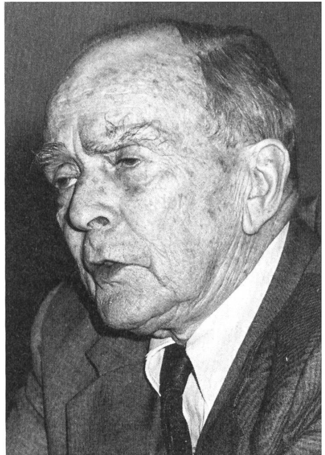
Sean MacBride, Vorsitzender der UNESCO-Kommission zum Studium der Kommunikationsprobleme.

Wie ein wesentlicher Teilbereich der Kommunikation, die Information, weniger den Bedürfnissen der Menschen als wirtschaftlichen und politischen Überlegungen folgt, lässt sich drastisch am Beispiel der Nachrichtenagenturen ablesen. Fünf Agenturen – Agence France-Presse (Frankreich), Associated Press (USA), Reuters (Grossbritannien), Tass (UdSSR), United Press International (USA) – beherrschen mit der technolo-