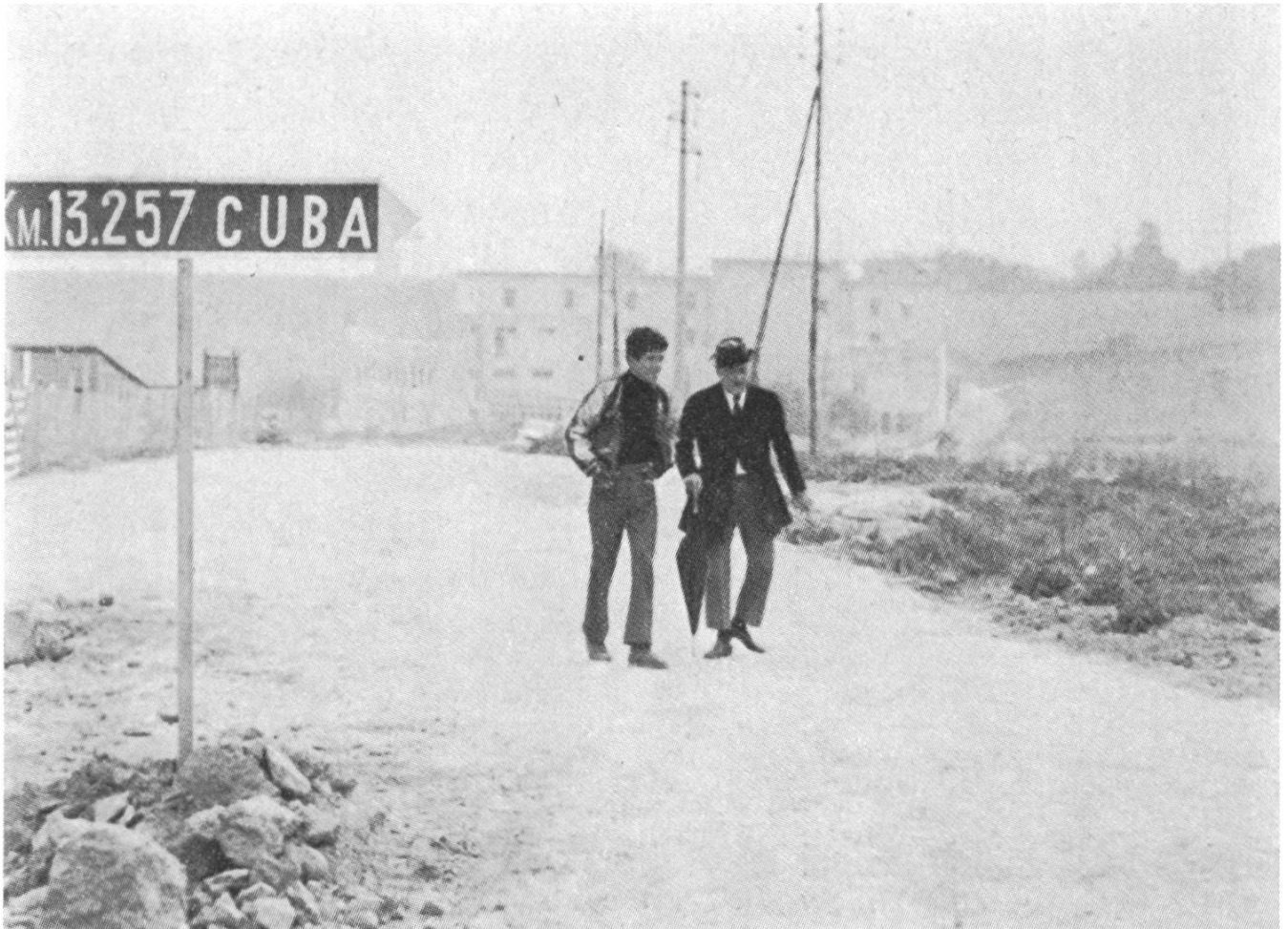
Totò und Ninetto Davoli als Vater und Sohn in Pier Paolo Pasolinis «Uccellacci e uccellini».

Schäferhunden eines hohen Herrn auf den Boden geworfen und festgehalten. Als inhaltlich bedeutungsvollen Stilbruch lässt Pasolini Vater und Sohn zu Zeugen direktester Wirklichkeit werden; in den Film eingebaut, sind Dokumentaraufnahmen des Begräbniszugs des PCI-Vorsitzenden Palmiro Togliatti. Totò und Ninetto sehen, wie Italiener mit geballter Faust und gleichzeitiger Bekreuzigung von einem Mann Abschied nehmen, der sich für einen lebensnaheren Kommunismus ausgesprochen hat. Bei dieser Sequenz muss man weiter wissen, dass Togliatti von seinen Freunden und Anhängern «Rabe» genannt wurde. Nach einer kurzen, aufheiternden Episode mit einem freizügig am Strassenrand sitzenden Mädchen (Vater wie auch Sohn verschwinden einige Augenblicke im Maisfeld, während im Hintergrund Flugzeuge starten und landen) ist es der