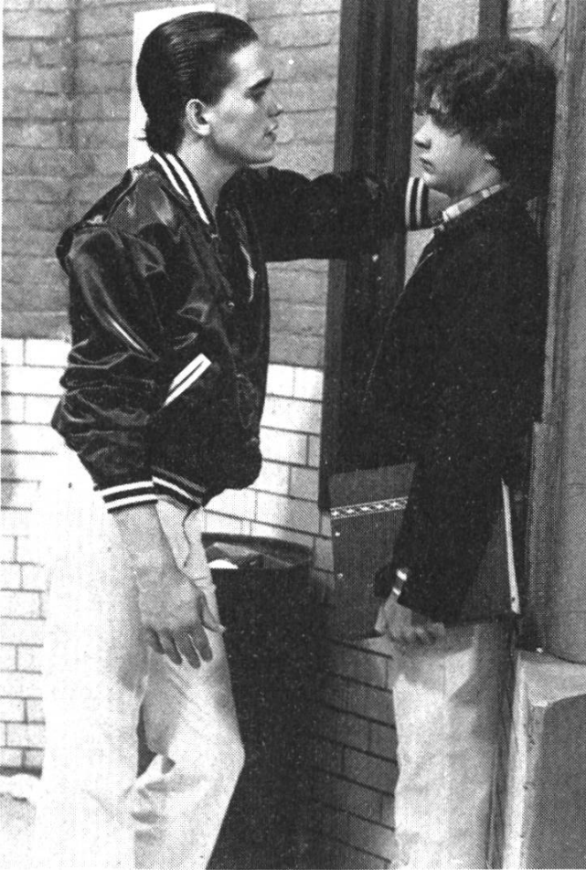
Hackordnung im Schulhof: «My Bodyguard» von Tony Bill.

sammen: Ricky hat sein Motorrad aus dem Wasser gehoben und trifft, nachdem ihn Clifford gesehen hat, erneut auf Moody und seinen Leibwächter. Diesmal schlägt, wie aus Erfahrung klug geworden, auch Linderman zu. Ricky besiegt den Leibwächter und Clifford den pomadigen Moody.