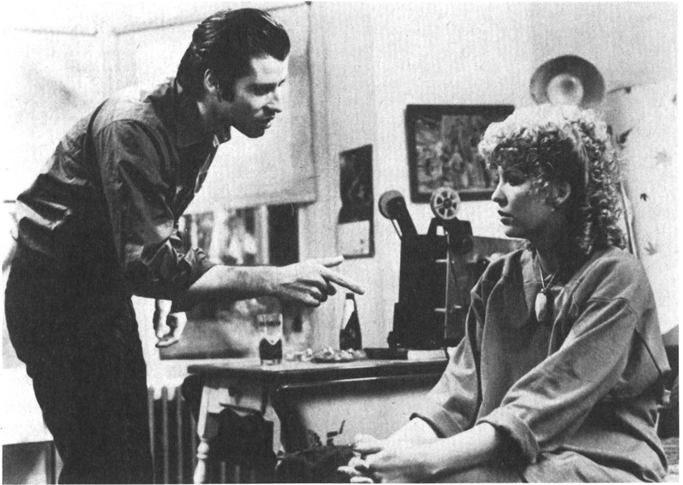
John Travolta und Nancy Allen.

der hat inzwischen wichtige Spuren beseitigt und alle Tonbänder Jack Terris gelöscht. Alle ausser der Originalaufnahme, die er in seiner Wohnung versteckt hatte. Mit Hilfe von Sally, die er aus dem Auto gerettet hatte, kommt Jack in den Besitz von Karps Original-Film, der seine Mord-Theorie endgültig absichert.