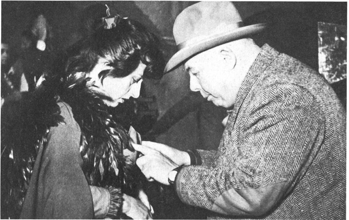
Anna Magnani und Jean Renoir bei den Dreharbeiten zu «La Carrozza d'Oro».

dell'Arte-Truppe auf, die mit dem selben Schiff wie die Kutsche voller Hoffnung aus Europa herübergekommen ist, um «in dieser märchenhaften Neuen Welt ihr Glück zu machen», folgt dieser Komödiantentruppe, die im Gasthof des Nestes ihr «Theater», einen heruntergekommenen Hinterhof, in dem die Hühner gackern, übernehmen, herrichten und ihr Spiel eröffnen wird. Die Kamera wird, wenn der Vorhang aufgeht, auch auf und hinter diese Bühne fahren, schliesslich sogar hinter den Vorhang dringen, der Colombine als Garderobe dient – und die Kamera wird selbstverständlich auch den ganzen Weg zu ihrer Ausgangsposition, vor den (allerersten) Vorhang in den Zuschauerraum – sprich: Kino –, zurückfinden.