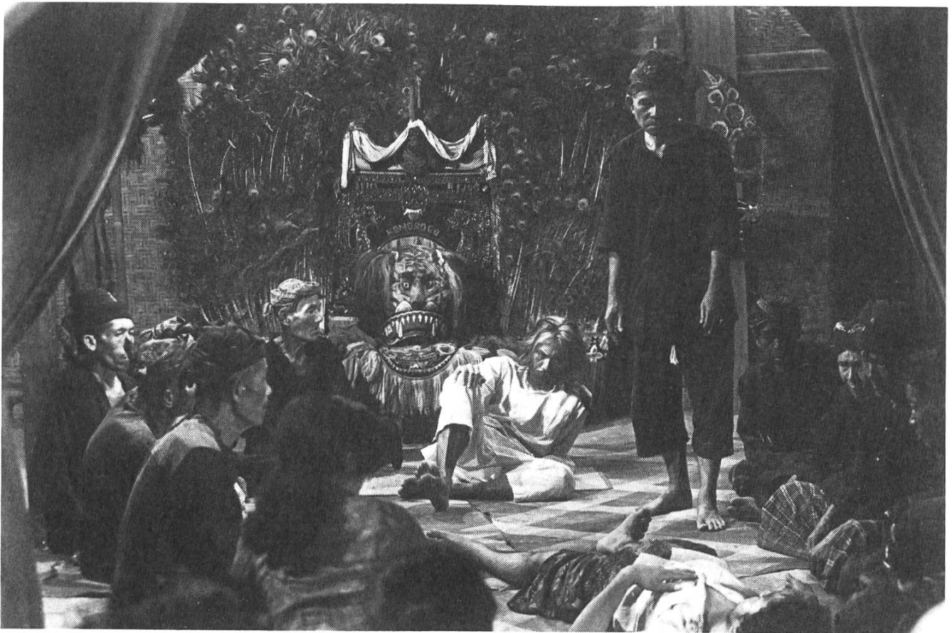
«Gedicht» auf die javanische Dorfkultur: «Rembulan dan matahari».