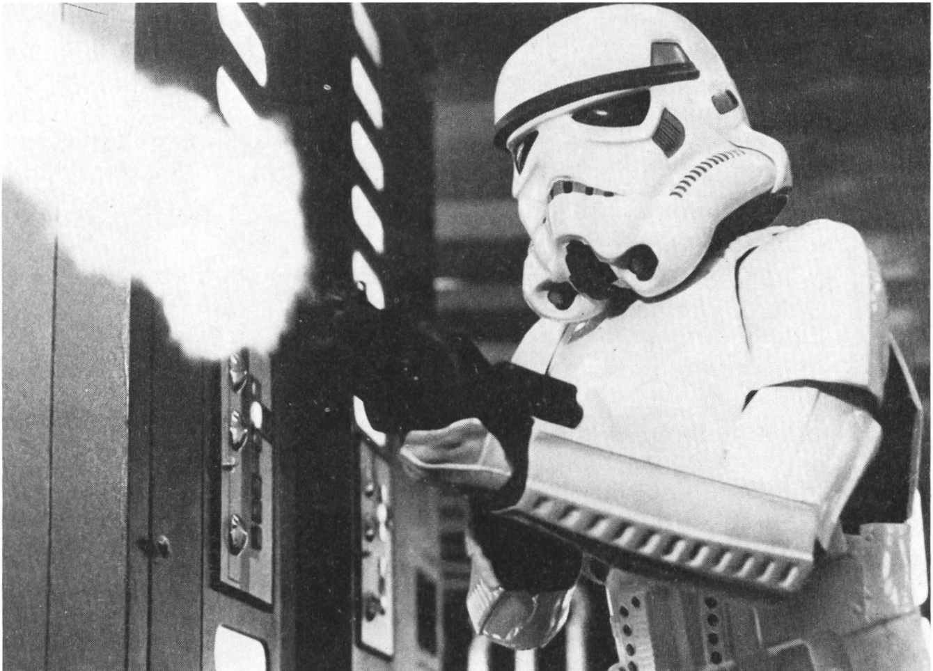
Barbaren im Weltraum: «Star Wars».

ser Körper im blutigen Kampf mit den Gegnern zur mechanisch funktionierenden Kampfmaschine wird. Je härter man sich gibt, je schneller man schießt, fährt, schlägt, umso mehr Chancen hat man zum Überleben (d. h. Weiterkämpfen). «Das ist eine neue Welt mit neuen Regeln», sagt Straker dem Mädchen Corlie in « Battletruck », und verschmiert ihr dabei das Gesicht mit dem Blut eines Erschossenen.