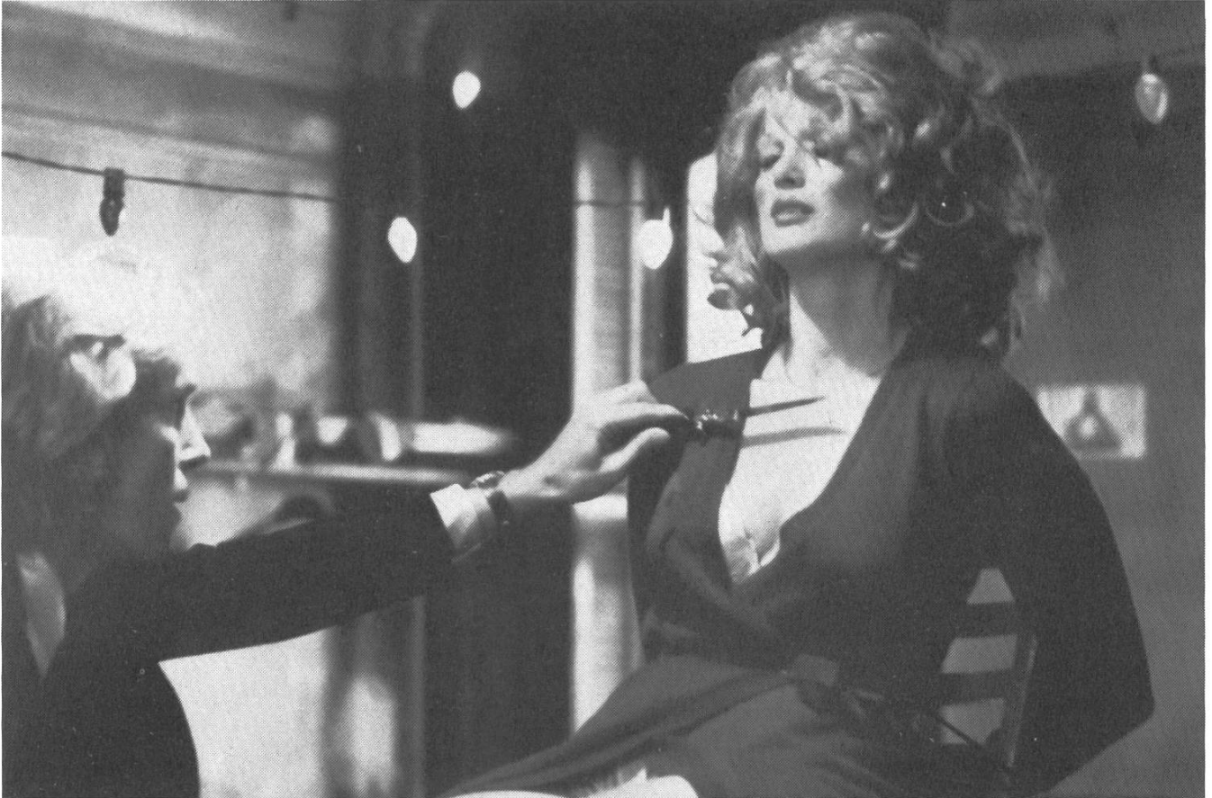
Herrschen durch Gewalt: «I, the Jury».

dieser Freiheiten. Lockerungen bestehen dabei vor allem darin, das Angebot an Ersatzbefriedigungen zu vergrößern. Die Grenzen dieser Freiheiten sind indes für jedermann spürbar, und es kann, wenn der soziale Halt bröckelt, der Augenblick kommen, wo der Wille zur Vernichtung nicht nur der Frau, die scheinbar so voller Gefahren und schuld an der ganzen Misslage ist, überhand nimmt, was in seiner mildesten Form auf Papier und Kinoleinwand geschieht, wo Menschen mit Worten und Bildern gemordet werden.