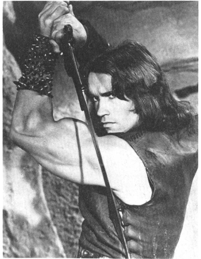
Männerphantasien: «Conan the Barbarian».