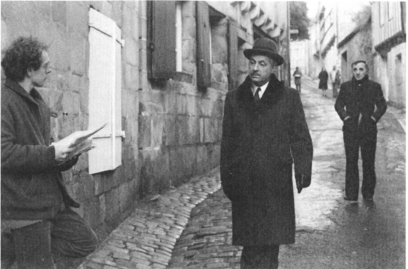
Vom Bösen unwiderstehlich angezogen: Charles Aznavour folgt Michel Serrault.

Wetter Labbé folgend, geholt hat. Der Hutmacher besucht den Todkranken und beichtet die Morde. Katchoudas Tod beendet das Spiel des Hutmachers. Es besteht auch kein Grund mehr zu weiteren Morden; denn die Freundinnen seiner Frau sind alle umgebracht. So allein gelassen mit seinen Phantomen, lockt Labbé, jetzt erst richtig verrückt, seine Haushälterin zu sich, um sie zu erwürgen, und auch Berthe, die Prostituierte, die Kindheitsgespielin, wird zu seinem – letzten – Opfer. Neben der Toten schlafend, wird er aufgefunden.