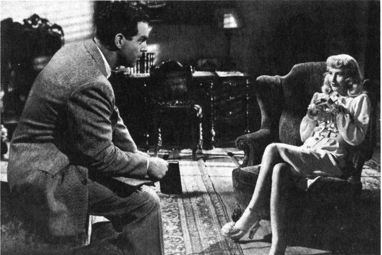
Fred MacMurray und Barbara Stanwick in «Double Indemnity».

Liebe Tod wird: Phyllis schießt am Schluss Walter nieder, lässt sich noch einmal umarmen, um vom verwundeten Walter getötet zu werden. Nur ist MacMurray auch bei seinem Abgang alles andere als engelhaft; er schleppt sich in sein Büro, um auf Tonband ein Geständnis zu sprechen. Nachdem er noch kurz mit Keyes gesprochen hat, bricht er über einer Türschwelle zusammen. Dabei ist eigentlich Walter die Hauptperson des Geschehens. Folgerichtig erleben wir Phyllis aus seiner Perspektive, die von Missverständnissen und Verdrängungen nicht frei ist. Ausserdem kann man bei Barbara Stanwycks Spiel spüren, dass sie als Phyllis mit all ihrem Egoismus, ihrer Engstirnigkeit und Lieblosigkeit auch den Menschen unter dieser Schale erfahrbar macht, der es verlernt hat, in einer erbarmungslosen Umwelt konfliktfähig zu sein.