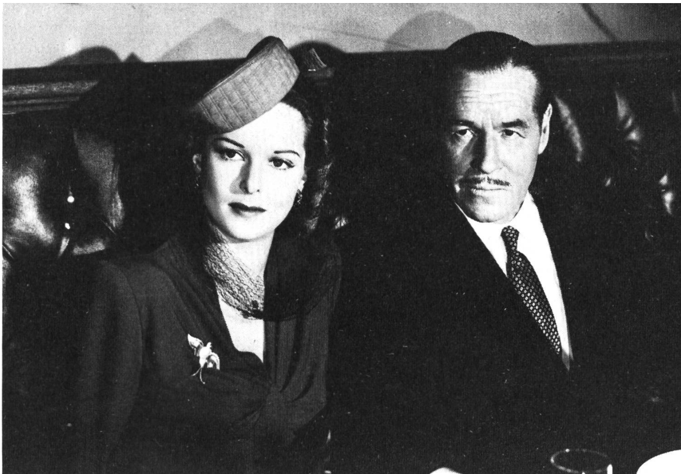
Horror im Kopf des Zuschauers (Jane Randolph und Jack Holt).