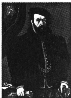
SCHULTHEISS HANS STEIGER ANNO 1571 IM ALZHEIMERS Für die Berner Burgerbibliothek Bern Druck: Carl Schmid

186 Seiten, 1 Frontispiz, gebunden, Fr./DM 28.–