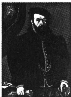
SCHULTHEISS HANS STEIGER ANNO 1571 IM ALZHEIMERS Für das Berner Burgerbibliothek Bern

186 Seiten, 1 Frontispiz, gebunden, Fr./DM 28.–