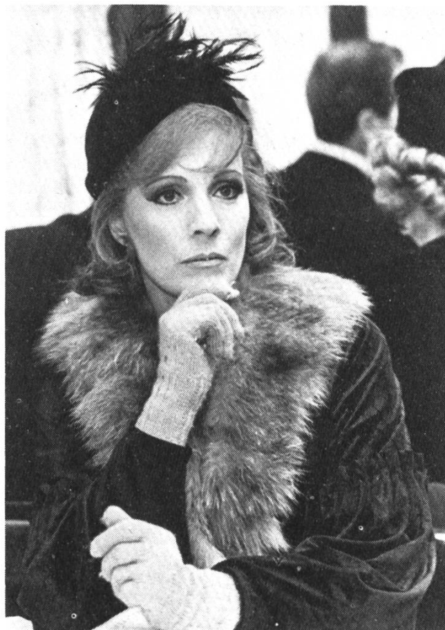
Julie Andrews als Victor/Victoria.

Diesen Satz in einer amerikanischen Musical-Komödie zu hören, erstaunt. Grund zum Staunen bietet der Film noch mehr. Als (schwuler) Mann darf die Frau den Männern Sätze vorwerfen wie «Ich muss mir meine Männlichkeit nicht dauernd beweisen» oder «Homosexualität verängstigt die Heterosexuellen». Und an diesem Punkt kriegt ja auch der grosszügige Mann, der seiner Geliebten die eigene Karriere zugesteht, Riesenprobleme. Denn Victoria bleibt nach aussen Victor, und ihr Freund wird dadurch zum Schwulen gestempelt. Prompt erfährt er, Mode hin oder her, die soziale Ächtung: Er, der drüben im Amerika der Prohibitionszeit als Alkoholschieber mit der Mafia Geschäfte trieb, ist als Tunte in dieser dem Machismo verschworenen Gesellschaft untragbar. Da endlich wirft Victor das Handtuch und wird dem King zuliebe wieder ganz Frau. Mit diesem Schluss nimmt die Filmfabel einiges an gesellschaftspolitischer Brisanz wieder zurück. Offen bleibt, ob sie als «sie» singend ebenfalls Erfolg hat und haben darf; der Film bringt immerhin das Kunststück fertig, dass sich der durchschnittliche Kino-