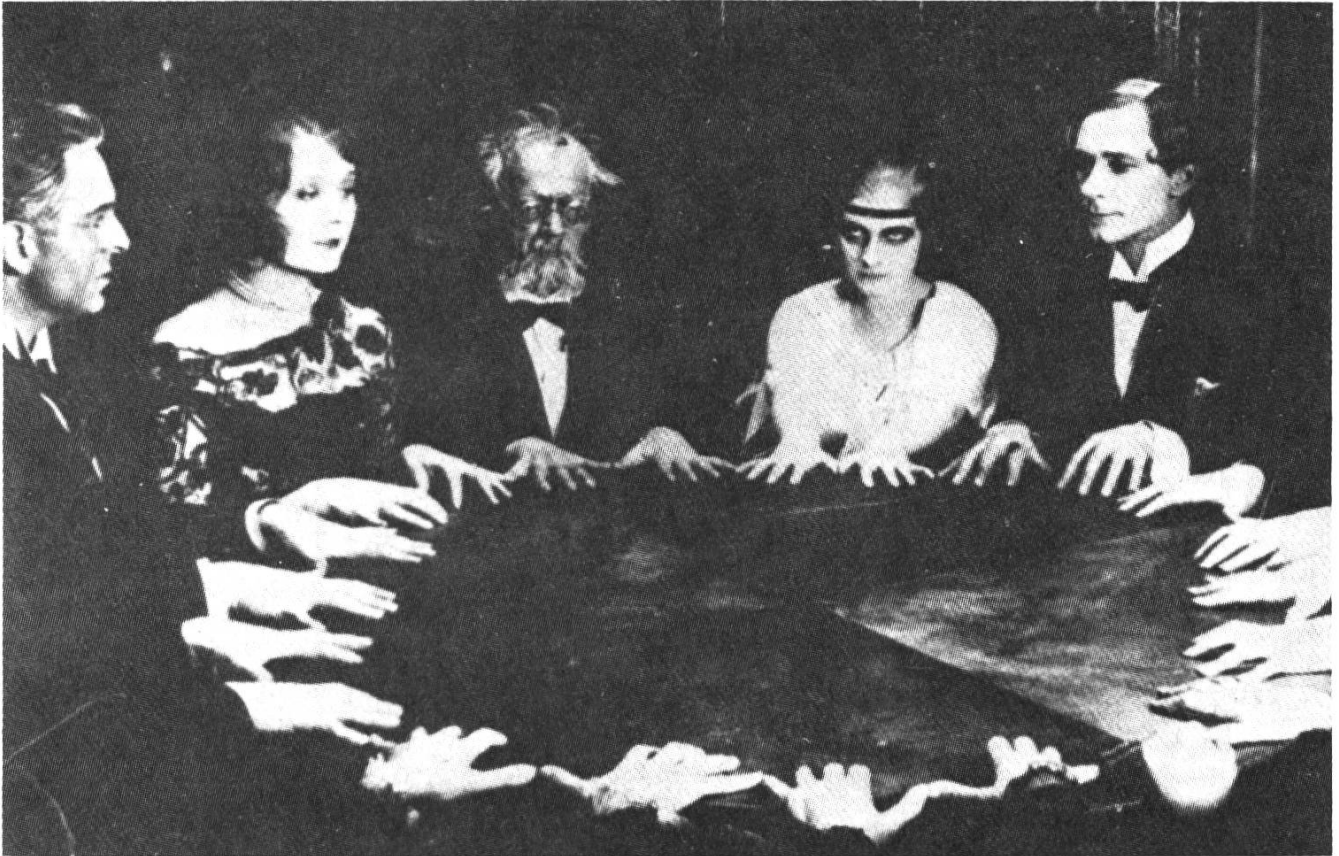
Alfred Abel, Gertrude Welcker und Rudolf Klein-Rogge (von rechts nach links).

Fritz Lang hat drei «Mabuse»-Filme gemacht: «Dr. Mabuse, der Spieler» (1921/22), «Das Testament des Dr. Mabuse» (1932) und «Die tausend Augen des Dr. Mabuse» (1960). Vom letzten, der auch Langs letzter Film geblieben ist, soll hier weiter nicht die Rede sein, obwohl er in den sechziger Jahren eine ganze Welle von Mabuse-Filmen ausgelöst hat.