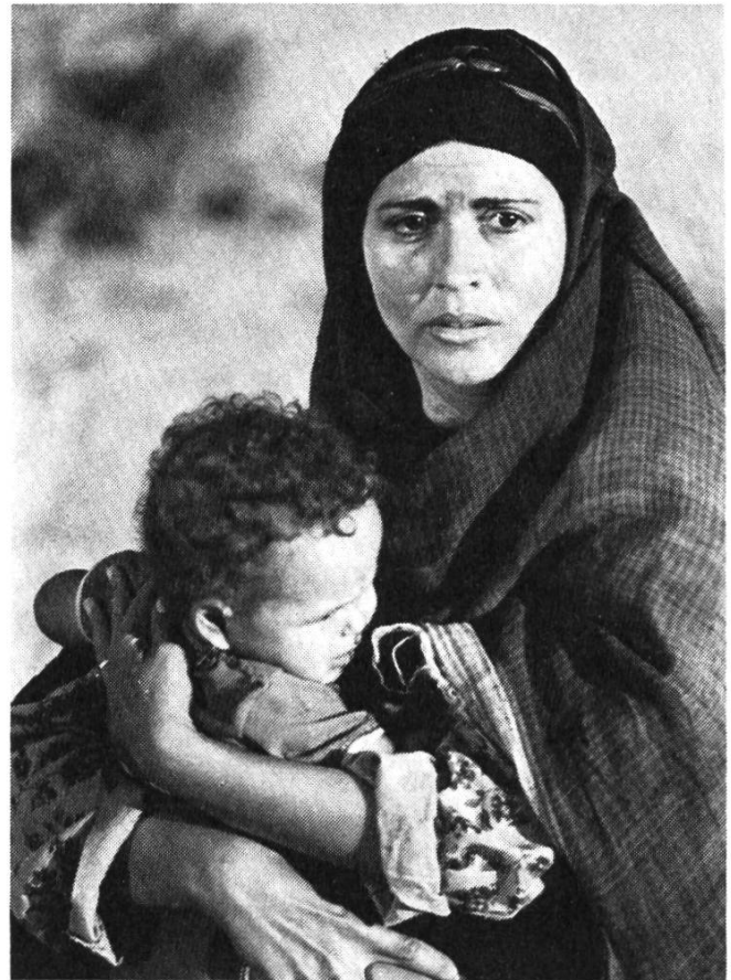
In «Dhil Al-Ardh» ist die Frau oft treibende Kraft und Mutter des Lebens.

Weg zum Hafen von Tunis, wo sie den Sarg mit dem Toten abholen will. Er führt, in einer Art kommentierendem Epilog, an einem zerfallenen Aquädukt vorbei, in den Lärm und die Anonymität einer lebensfeindlichen Stadt aus Beton. Und am Hafen wird der Frau erklärt, heute sei Samstag, das Areal geschlossen, das Abholen der Leiche unmöglich. Das letzte Bild zeigt, wie der Sarg hoch oben am riesigen Kranhaken über den Docks schwebt, keinen Boden, keine Erde findet. Die brutale Technik weiss mit ihm nichts anzufangen: Der tote Salah wird zum Sinnbild einer ganzen Kultur. Die grellen Töne des Dudelsacks erinnern an die trillernden Schreie der Frauen am Hochzeitsfest; die Sirenen werden zum Alarm.