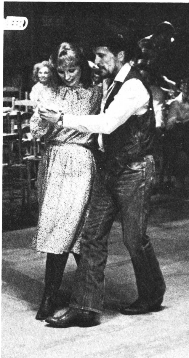
Tess Harper und Robert Duvall.

Die Bilder dieser abgelegenen Idylle, oft aus identischen Kamerapositionen zu verschiedenen Tageszeiten mit entsprechend verändertem Hintergrund aufgenommen, tauchen regelmässig auf in diesem Film, so dass man versucht ist, in ihnen Leitmotive zu sehen und sie in ihrer Summe als Sehnsucht nach einfachem, urtümlichen Leben zu interpretieren, wie Regisseur Bruce Beresford («Breaker Morant»), Drehbuchautor Horton Foote und Hauptdarsteller und Co-Produzent Robert Duvall sich das vorstellen. Natürlich zerbricht man sich auch in diesem beschaulichen amerikanischen Melodram über Frauen den Kopf. Am wenigsten auffällig ist Rosalyn, obwohl ihr doch am Anfang des Films schon fast mystische Wunderqualitäten bescheinigt werden, da sie Mac mit ihrer blossen Anwesenheit vom Alkohol kuriert, obschon er wenig später als schwer süchtig charakterisiert wird. Ansonsten ist Rosalyn eine Frau wie viele: Sie ist immer da, wenn man sie braucht, sie arbeitet von morgens bis abends, kocht, putzt, wäscht, besorgt die Tankstelle. Wenn Mac ein Konzert besucht, bügelt sie frische Wäsche; wenn er sporadisch wieder nächtelang herumstreunt, wartet sie geduldig zuhause, um