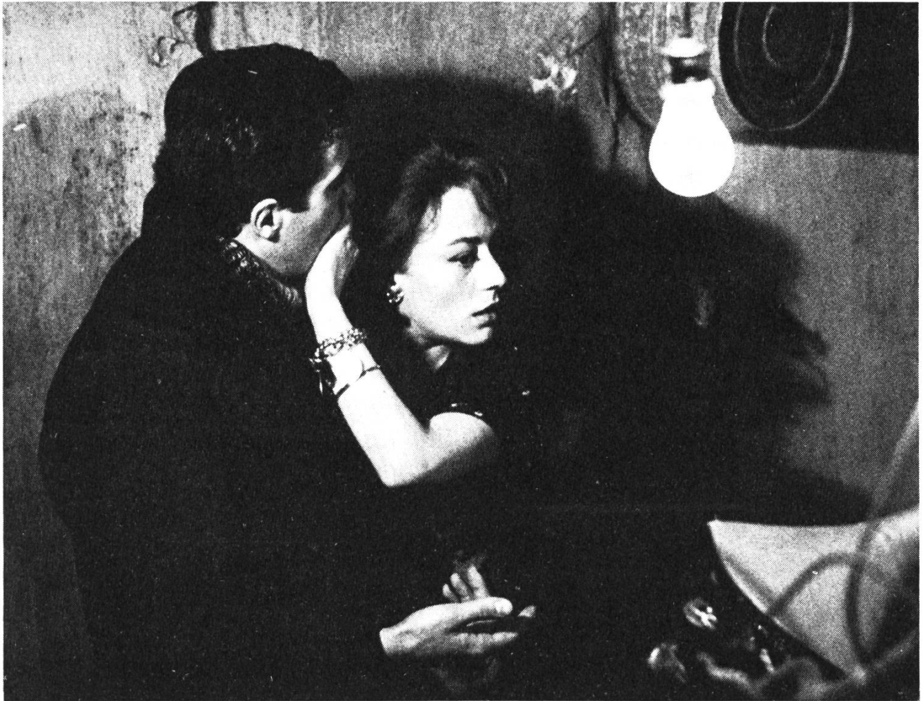
Spiros Focas und Annie Girardot.

werfen, allerdings nur scheinbar, um sich an ihm rächen zu können: Sie schraubt ihre Anforderungen so hoch, dass Simone noch mehr zum Spieler und Kriminellen wird, um sie zu befriedigen.