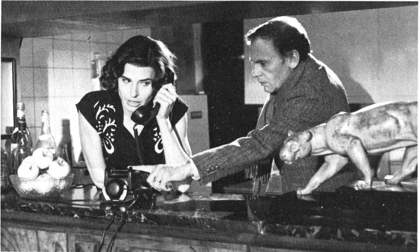
Fanny Ardant als leidenschaftliche Amateurschauspielerin und -detektivin und Jean-Louis Trintignant als Immobilienhändler.

Kino-KassiererIn, ein schon von weitem als böse erkennbarer Nachtclub-Boss, ein dubioser Anwalt, ein echter, dafür unfähiger Privatdetektiv und – natürlich – ein misstrauischer Polizei-Kommissar mit Assistent, der alles zu vermasseln droht.