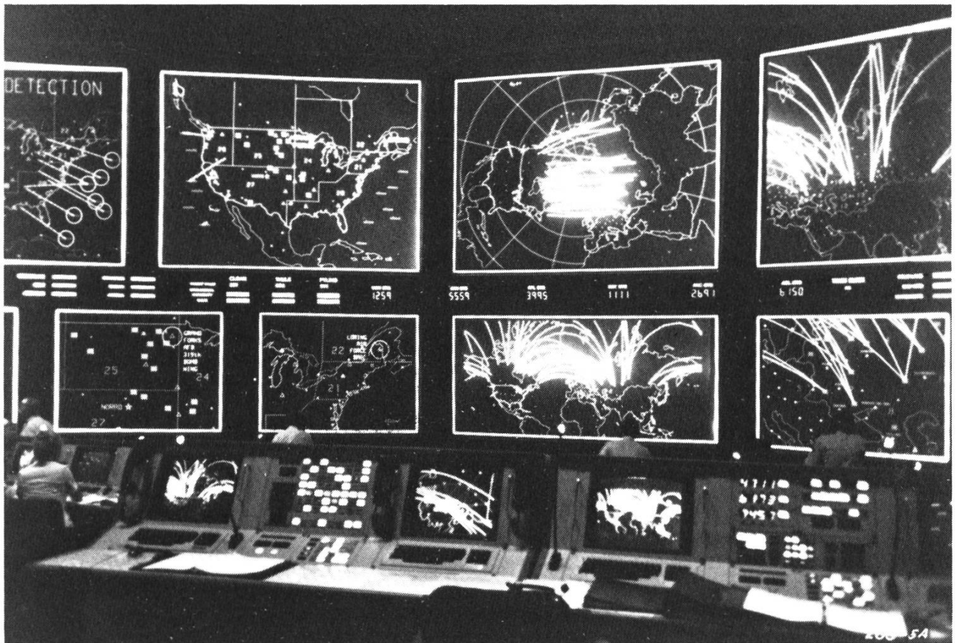
Computerbilder vom Atomkrieg.

Eines schönen Tages, auf der Suche nach einem Videospiel, das noch nicht auf dem Markt ist, kommt David in Kontakt mit einem unidentifizierbaren Computer-System. Seine Neugier ist geweckt, und nach etlichen Recherchen findet er das Codewort, um Zugang zum Programm dieses geheimnisvollen Computers zu erhalten. Dieses Codewort lautet «Joshua», was nichts anderes bedeutet als den Namen des kleinen Sohnes von Dr. Falken (John Wood), dem genialen Erfinder dieses Computers. Der Computer spricht David auch prompt als Dr. Falken an und fordert ihn auf, aus einer langen Liste von Spielen, vom einfachen Schach bis zum atomaren Weltkrieg, eines auszuwählen. Selbstverständlich wählt David den atomaren Weltkrieg und übernimmt darin die Rolle der Sowjetunion, während der Computer die der Amerikaner simuliert.