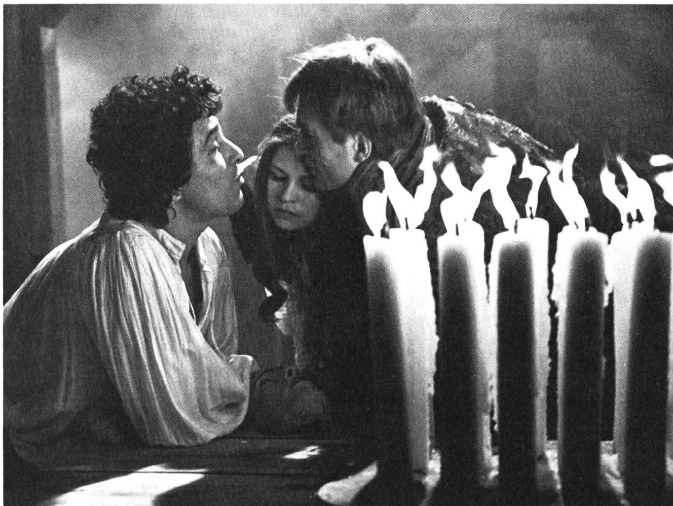
Spiele der Macht am Königshof: «Das Herz des Tyrannen» von Miklós Jancsó.

tentanz, in einem makabren Mörderballet ohne Sieger, jedoch mit dem Filmzuschauer als gänzlich verunsichertem Zeugen. Bis dahin nämlich haben ihm die handelnden Figuren (es sind nicht Personen mit individuellen Zügen) den scheinbar sicheren Boden der «Wirklichkeit» nach und nach unter den Füßen weggezogen, sie haben ihre vorgegebenen Konturen von gut und böse aufgegeben, jede Partei gibt sich als lediglich Theater spielend zu erkennen und mokiert sich gleich selbst über das grellrot vergossene Blut, das ja doch nur Tomatensaft sein dürfte. Nach vollbrachter Spielerei, Spiegelfechtereier und ritueller Schlächtereier also fallen sich Freund und Feind versöhnlich in die Arme, verlassen als ungeordneter Haufen Menschen den zum Gefängnis umgedeuteten ungastlichen Ort und schwärmen aus ins freie Feld. Plötzlich peitschen Schüsse, und die Spieler, die