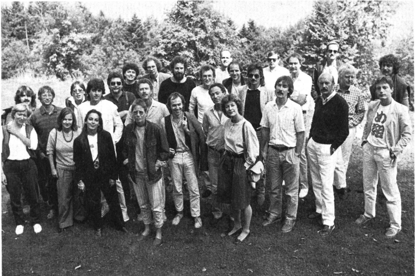
Gruppenbild mit vereinzelt Damen: DRS 3-Crew.

LP's, ab 17.00 Uhr: Singles) und anderer Musik auch aktuelle Sportmeldungen und Reportagen. Wird damit DRS 3 um einen Kanal reicher, auf dem im Leierton die ewig gleichen Sportresultate verlesen werden?