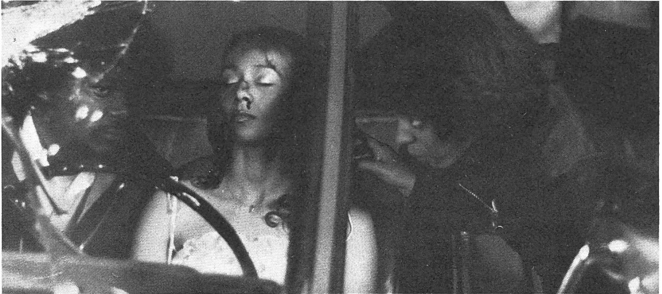
Aus «My Brother's Wedding»

Dampf entweichen. Es wird in geradezu beklemmender Weise sichtbar, wie sich der Vater an diesem Ausbruch, der eine in die Welt hinausgeschriene Aufforderung zum Widerstand ist, aufrichtet und Mut findet, das Schicksal wieder in die eigenen Hände zu nehmen. Das allein – Woodberry macht es deutlich – löst die Probleme nicht, aber es schafft den Durchbruch zur Suche nach neuen Wegen, die aus dem Schlamassel herausführen.