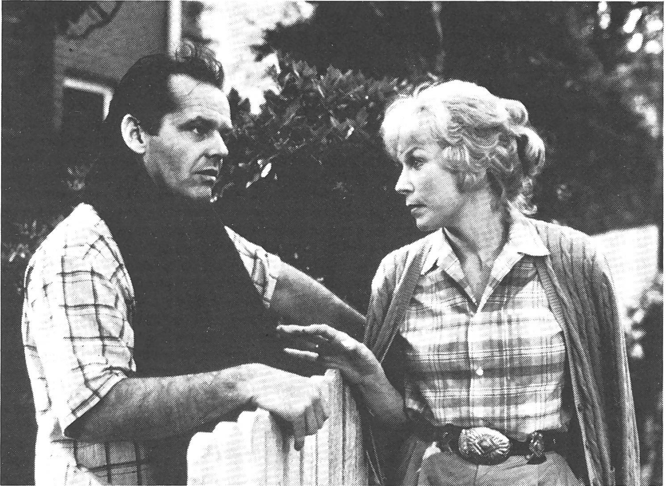
Grossmutter und notorischer Ladykiller: Shirley MacLaine und Jack Nicholson.

Dallas, sozusagen. Wenn Emma Ehebruch begeht – an sich schon ein recht beachtliches Ereignis in einem Hollywood-Familienfilm, in dem die Welt noch in Ordnung und eine richtige Frau überzeugte Gattin und Mutter ist –, dann tut sie es mit dem dicklichen Bankbeamten von der städtischen Sparkasse. Und wenn ihre Mutter Aurora die Lust am Sex entdeckt, dann ist sie – auch das nicht minder beachtlich – bereits eine wohlbestallte Grossmutter. Nach 15 Jahren Nachbarschaft erliegt sie endlich dem unflätigen Charme des notorischen Ladykillers Breedlove.