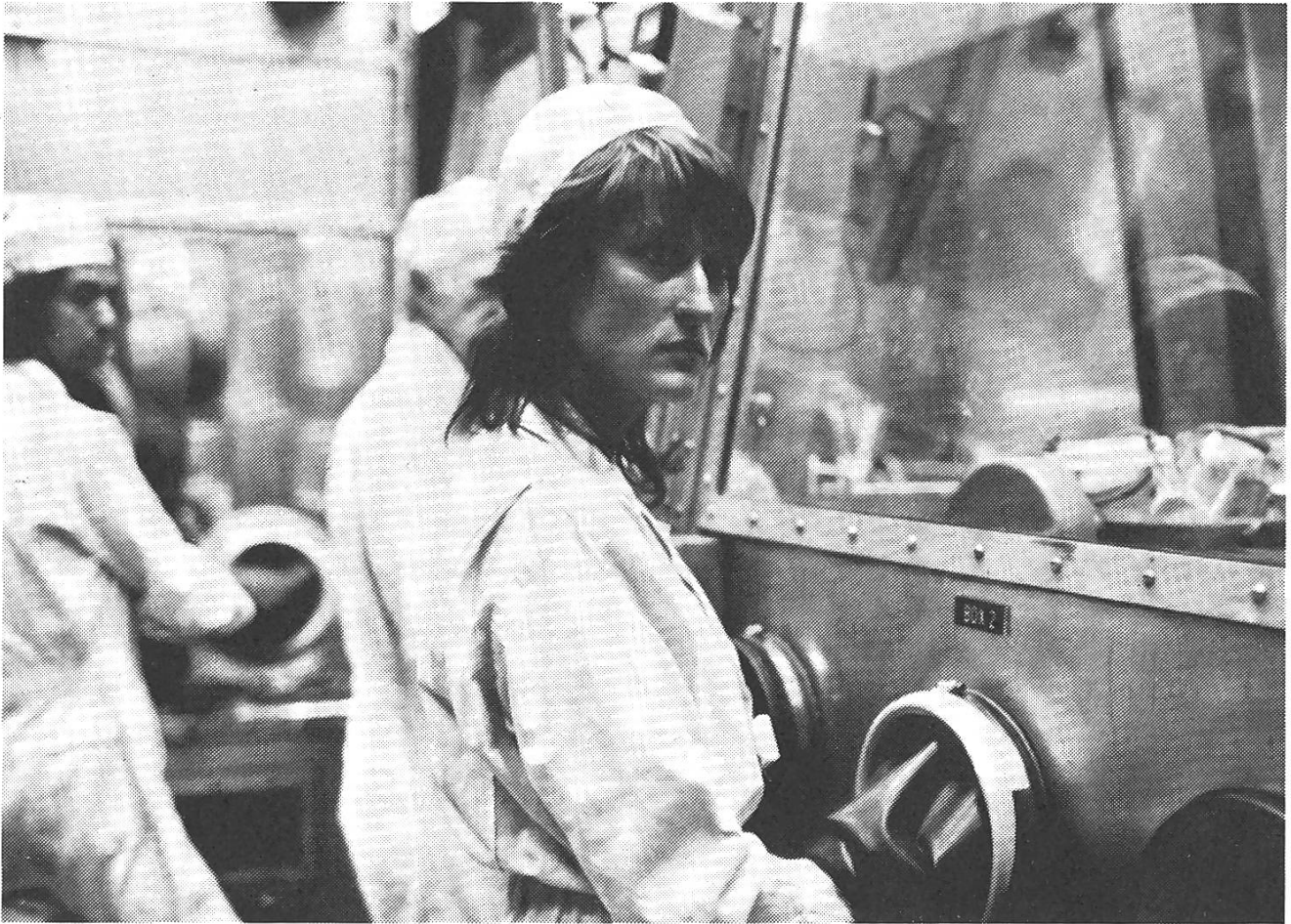
Gefährlicher Arbeitsplatz in der Plutoniumfabrik: Meryl Streep als Karen Silkwood.

über die Sicherheitsbestimmungen und die Gefährlichkeit von Plutonium zu informieren und entdeckt grobe Unzulänglichkeiten in ihrer Fabrik. Um dagegen anzukämpfen, wird sie aktiv in der Gewerkschaft und beginnt in der Fabrik zu recherchieren. Dabei entdeckt sie, dass die Fotos der neuen Brennstäbe jeweils dort, wo sich Schwachstellen in den Schweissnähten zeigen, retouchiert werden. Mit diesem Kunstgriff wird der Fabrik eine Menge zusätzlicher Arbeit erspart. Dieser Kunstgriff kann aber auch Tausende von Menschen gefährden. Noch ehe die Fakten an die Öffentlichkeit dringen, wird Karen erneut das Opfer einer Verseuchung. Sie vermutet darin einen Anschlag auf ihr Leben. Motive sind gleich mehrere vorhanden: einmal auf seiten der Fabrikherren, dann aber auch von seiten ihrer Arbeitskollegen, die befürchten müssen, dass die Fabrik bei ei-