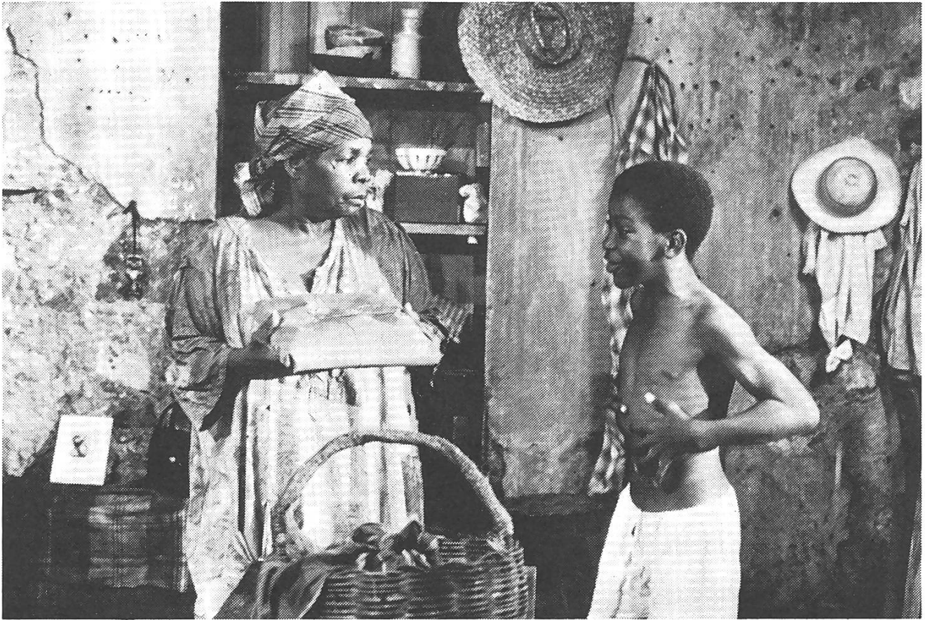
Darling Legitimus (links) hat in Venedig den Preis für die beste Darstellerin erhalten.

nen Hungerlohn auf der Plantage, angetrieben und gequält von weissen Aufsehern. Unterdessen gehören die Strasse und die Hütten den Alten und besonders den Kindern, ihren Spielen und kleinen Streichen. Sie haben an ihrem freien, ungebundenen Leben den grössten Plausch, auch wenn sie hin und wieder abends, wenn die Erwachsenen todmüde heimkehren, für ihre Lumpereien büssen müssen. Die meisten dieser Kinder haben keine andere Zukunft als die Sklavenarbeit auf den Plantagen oder sonst eine schlecht bezahlte Arbeit im Dienste der Weissen.