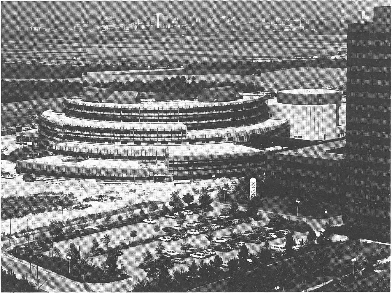
Steriles Klima, unter dem das Programm entsteht: Fernsehfabrik ZDF, Mainz.