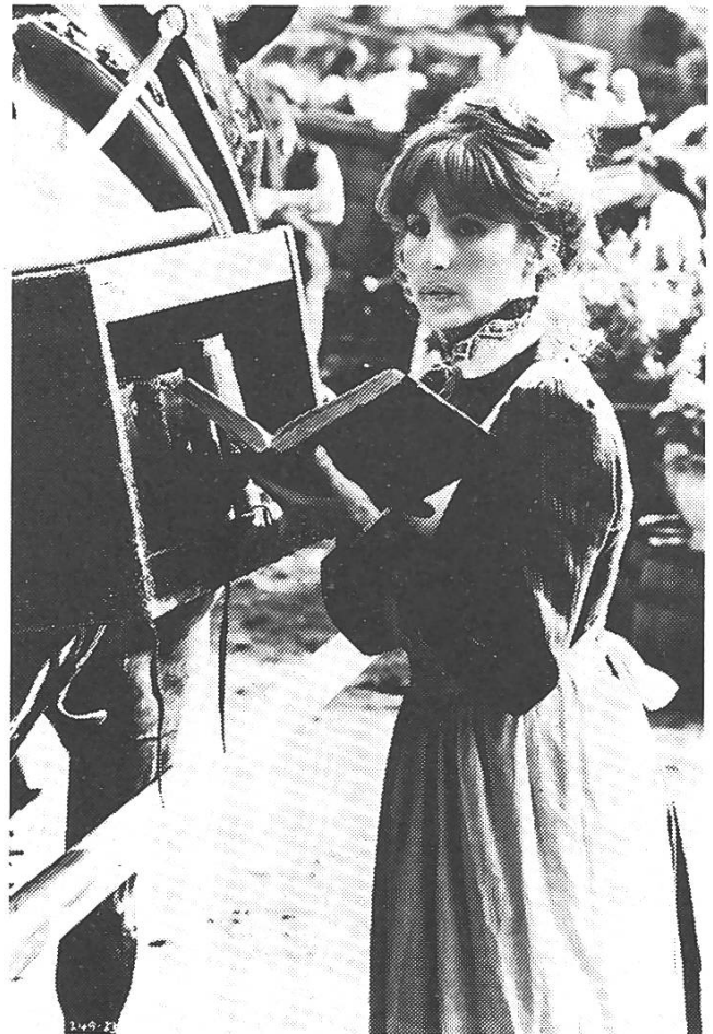
Barbara Streisand als lernwillige Yentl.

Die Verstrickungen, die durch das in einem eher realistisch gezeichneten Umfeld gekünstelt und unglaubwürdig wirkende Verkleidungsmotiv (das so eigentlich nur in einer Komödie verwendbar ist) entstehen, gewinnen im Verlauf der Handlung an Gewicht und verdrängen zusehends die Darstellung der Probleme einer Frau in einer Gesellschaft, in der die Patriarchen Bildung und Wissen für sich allein beanspruchen. Der Handlungsfluss