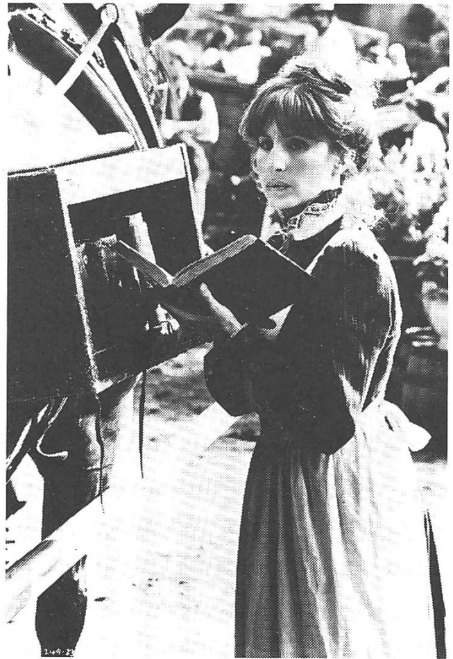
Barbara Streisand als lernwillige Yentl.

Die Verstrickungen, die durch das in einem eher realistisch gezeichneten Umfeld gekünstelt und unglaubwürdig wirkende Verkleidungsmotiv (das so eigentlich nur in einer Komödie verwendbar ist) entstehen, gewinnen im Verlauf der Handlung an Gewicht und verdrängen zusehends die Darstellung der Probleme einer Frau in einer Gesellschaft, in der die Patriarchen Bildung und Wissen für sich allein beanspruchen. Der Handlungsfluss