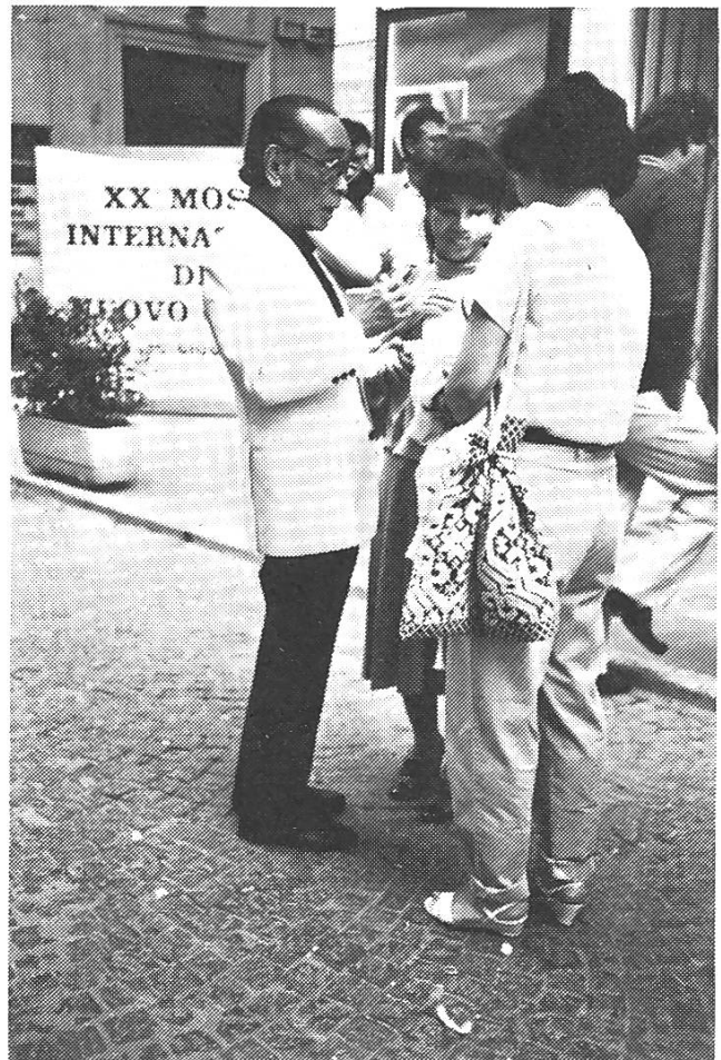
In Pesaro zur Überraschung: Keisuke Kinoshita im Gespräch mit einem koreanischen Filmschaffenden.

Obwohl sich «Pesaro» etwas zu einseitig auf die kinematographischen Erzeugnisse aus den fünfziger und sechziger Jahren konzentrierte – die goldene Zeit des japanischen Films, während der, vor dem Eroberungsfeldzug des Fernsehens, die meisten international bekannten klassischen Meisterwerke entstanden sind (beispielsweise «Rashomon» von Akira Kurosawa oder die 1949 begonnene Serie der berühmten Familienfilme von Yasuro Ozu) –, war die Veranstaltung ergiebig und aufschlussreich. Einmal weil ihr Reiz unter anderem darin bestand, vorwiegend Unbekanntes oder bisher weniger Bekanntes zugänglich zu machen. Zum andern, weil dieser Zugang nicht nur über die Filme vermittelt wurde, sondern darüberhinaus in den meisten Fällen, mittels allabendlicher «Incontri con i registi», auch durch deren Autoren zustande kam. Das ernsthaftere, über ein bloss «exotisches» oder modisches Interesse hinaus fortschreitende Bemühen um interkulturelle Kommunikation zeigt, dass solche Begegnungen auf der menschlich-kreativen Ebene durch keine noch so raf-