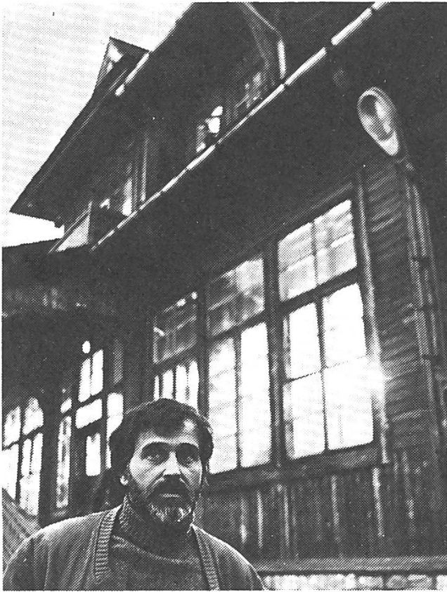
Jan Nowicki in «Spiral».

dass die Filmschaffenden ihr Erwachen und ihre Rebellion drei Jahre vor dem Entstehen von «Solidarnosc» erlebt haben. Es ist kein Zufall, dass unser damaliger Präsident, Wajda, als erster beim Streik in der Danziger Leninwerft erschien. Bedroht von einer Administration, die versuchte, unserem Beruf eine sehr harte Kontrolle aufzuzwingen, hatten wir uns zusammengeschlossen und handelten mit einer überraschenden Wirkung bereits im Jahre 1976/77. Wir machten eine ganz besondere Erfahrung in Gewerkschaft und öffentlichem Leben. Mir ist beispielsweise an einem Kongress von Filmschaffenden unter den Auspizien des französischen Kulturministeriums auf der Insel Madeira aufgefallen, dass die Cineasten in unserem Teil der Welt im Vergleich zu denen in westlichen Ländern viel mehr Erfahrung mit allen öffentlichen Aktivitäten haben. Sie kennen die Zwänge und Mechanismen von Kongress-Demokratien viel besser und sind sich der möglichen Manipulation von Abstimmungen und Verfahren weit stärker bewusst. Ich erwähne dies deshalb, weil