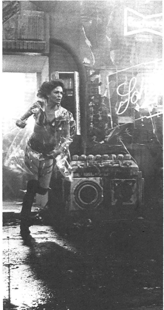
Erwachen in der schmutzigen Zukunft: «Blade Runner» von Ridley Scott (USA 1982).

Es ist die Frau, etwa in einem so reflexiven Film wie Marco Ferreris «Ciao, Maschio» ( Affentraum ; ZOOM 13/78) oder in der erotischen Metapher wie «Alien» , die