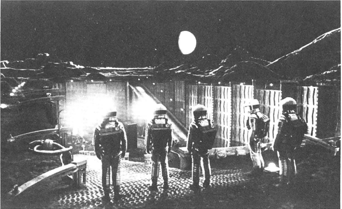
Science-Fiction-Klassiker «2001: A Space Odyssey» von Stanley Kubrick (USA 1968).

stern will er vom Morgen ins Heute. Natürlich ist die bessere politische und individuelle Moral auf seiner Seite. Aber meistens nur, weil wir uns so listenreich ein falsches Morgen haben aufschwätzen lassen. Mut zur Zukunft ist beileibe nicht die Sache des kritischen SF-Films; er argwöhnt – im allgemeinen – in der Art eines Stammtischbesuchers, dass alles genauso schlimm kommt, wie er befürchtet, weil alle anderen zu dumm sind, es zu sehen und zu verhindern. Von dieser so unlustigen, so mutlosen, dem Weltbild des ewigen petit bourgeois huldigenden Zukunftsperspektive möchte ich aus der SF-Reihe des Fernsehens DRS allenfalls drei oder vier freisprechen.