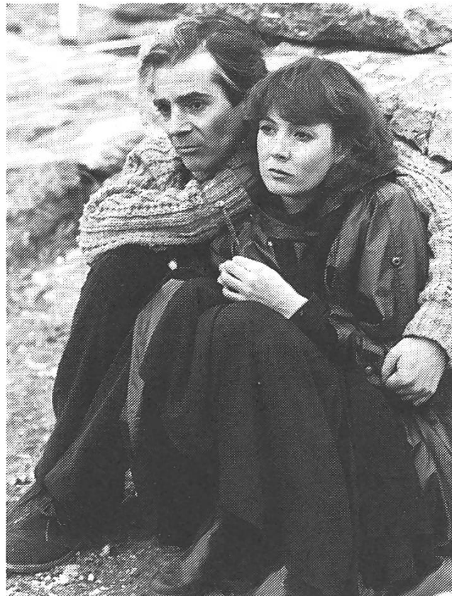
Geschichte einer Passion über den Tod hinaus: Pierre Arditi und Sabine Azéma in « L'amour à mort » von Alain Resnais.