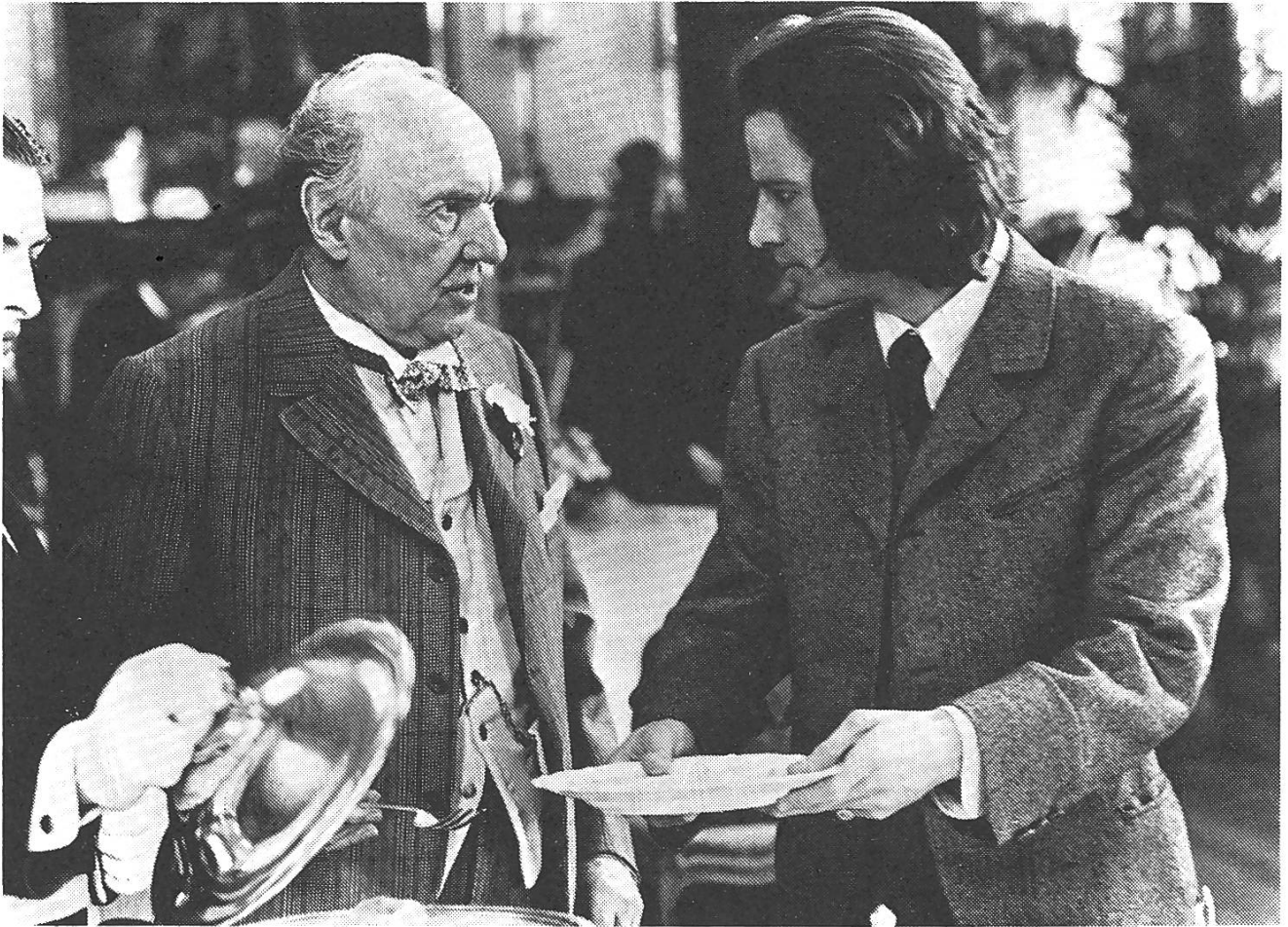
Christopher Lambert (r.) als zivilisierter Affenmensch und Ralph Richardson (l.) als dessen skurriler Grossvater.

terrichtet und ihm – beeindruckt von seiner ehrlichen Direktheit und Unverdorbenheit – auch menschlich näherkommt. Doch die Familie und ihre Geborgenheit, die ihm der belgische Forscher in der menschlichen Gesellschaft versprochen hat, kann er nicht finden. Nach dem Tod seines Grossvaters und dem Tod seines «Affenvaters» – den er in einem Käfig im Naturhistorischen Museum in London wiedergefunden und befreit hat – wird die Suche nach seiner wahren Identität noch verzweifelter («Half of me is the Earl of Greystoke, and half of me is wild», erklärt er sein Dilemma), seine Sehnsucht nach der Kultur, in der er zuerst heimisch geworden ist, noch stärker. Er kehrt nach Afrika zurück. Die vom Forscher zu Jane geäusserte Hoffnung, dass er vielleicht eines Tages wieder in die Zivilisation zurückkomme, wirkt schwach angesichts