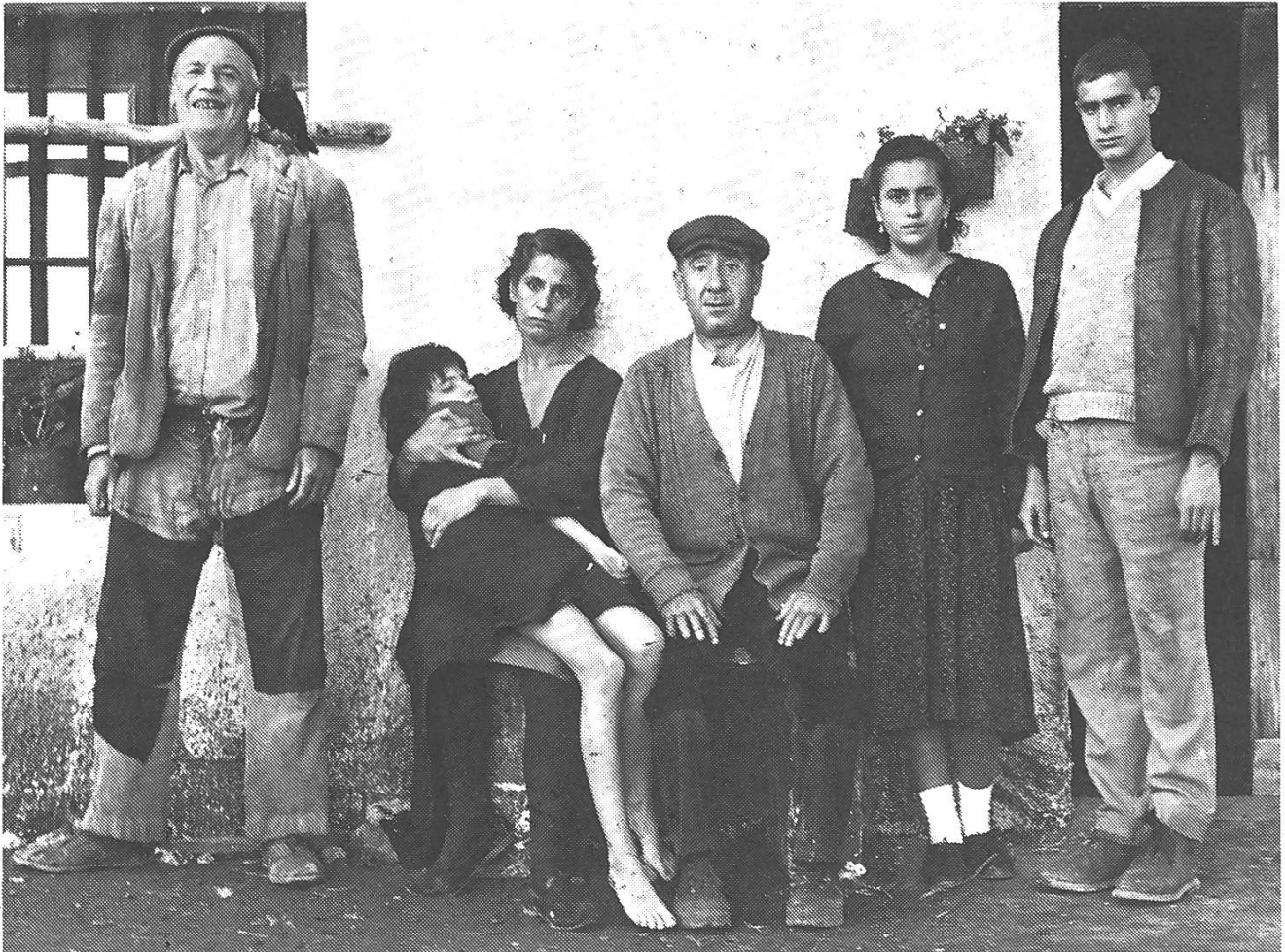
Vom Feudalherrn wie Leibeigene gehalten: ausgebeutete Bauernfamilie in Mario Camus «Los santos inocentes».

auch keineswegs objektiv, sondern durchaus parteilich) schildert Camus das Verhältnis zwischen Feudalherren und Untertanen. Das Verhalten der beiden bedingt sich gegenseitig wie in einer Symbiose, sie sind die Kehrseite ein- und derselben Medaille, nur steht auf der einen Seite die Macht und auf der anderen die Ohnmacht. Es gibt da Bilder, die sich unauslöschlich einprägen, schmerzhaft wie Stachel im Fleische, etwa wenn die Marquesa und Gutsherrin samt willfährigem Bischof zur Erstkommunion ihres Enkels auf dem Gut erscheint und das Kind, ihren Erben, unter einem weitausladenden Baum im Freien huldvoll Almosen an die Bediensteten verteilen lässt, oder wenn Paco, von seinem Herrn als unentbehrlicher Helfer zur Mehrung seines Prestiges auf die Jagd mitgenommen,