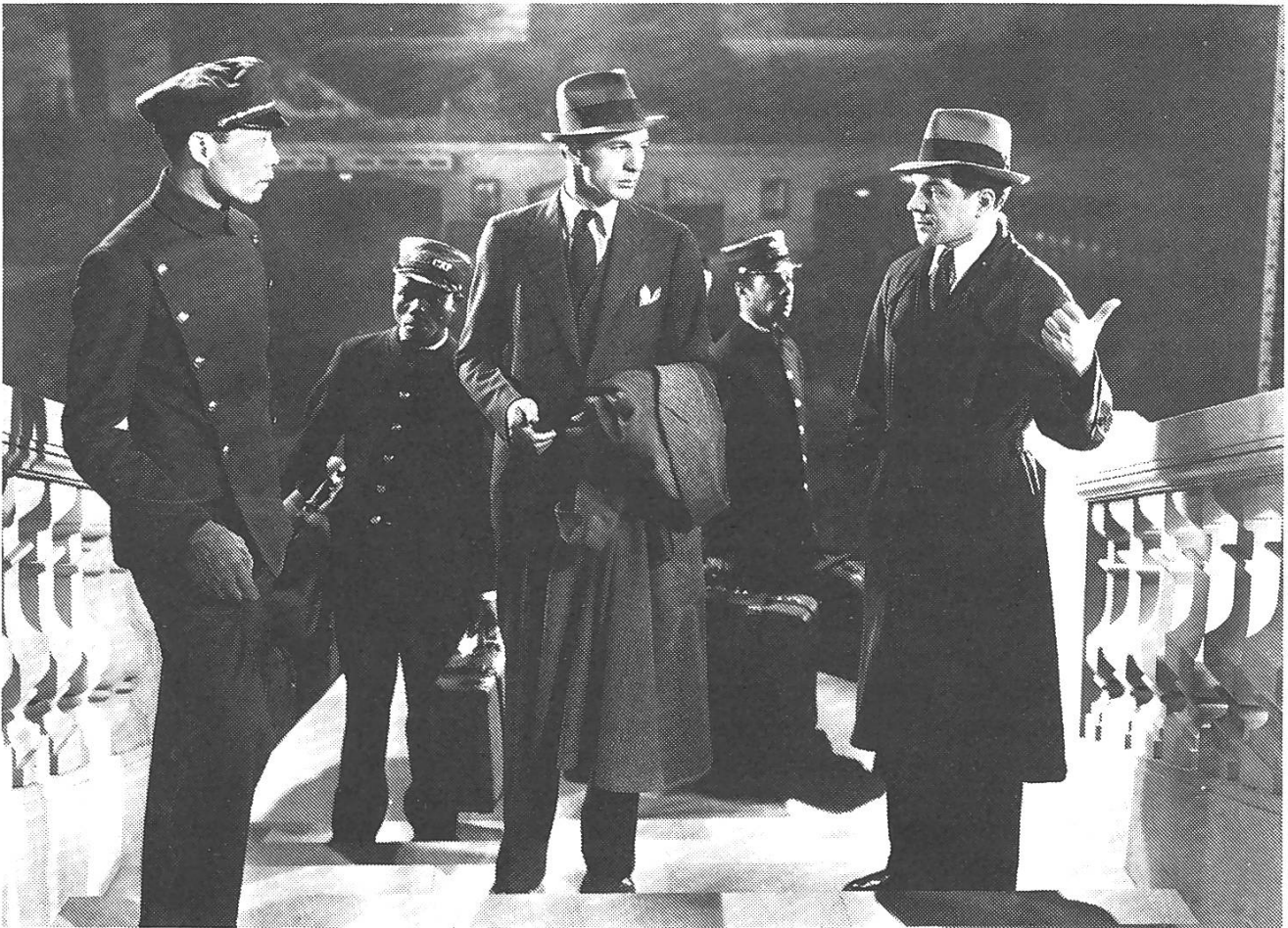
Aus Frank Capras «Mr. Deeds Goes to Town».

With You » aus dem Jahre 1938. Capra bleibt auch hier ganz dem Gedankengut Roosevelts verhaftet, der gerade gegen Ende der dreissiger Jahre neben seinem Reformprogramm vor allem eine Politik der nationalen Einheit zu betreiben gedenkt: