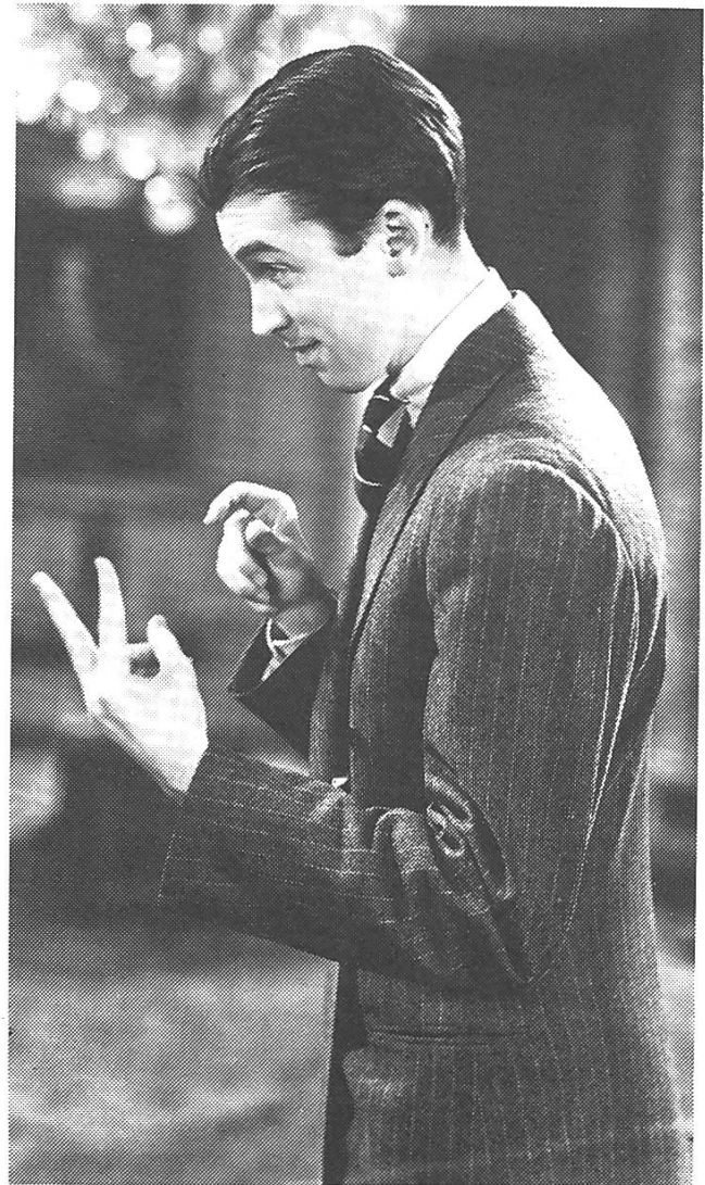
James Stewart in Frank Capras «You Can't Take It With You».

schliesst einen Vertrag mit den krisengeschüttelten Columbia Pictures Harry Cohns. Schon der erste Capra-Film bei Columbia wird ein grosser Erfolg, und auch die weiteren Filme finden beim Publikum grossen Anklang. Cohn ist gerettet und Capra hat es geschafft. Von 1928 an gehört er zur Spitze der Hollywood-Regisseure und geniesst eine so grosse Unabhängigkeit wie sie von seinen Kollegen höchstens Ernst Lubitsch in Anspruch nehmen kann.