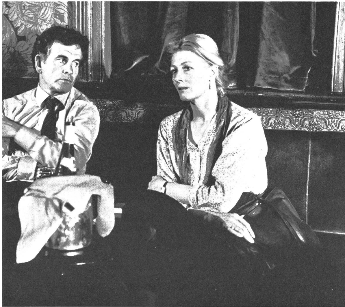
Vanessa Redgrave und Ian Holm in «Wetherby» von David Hare.