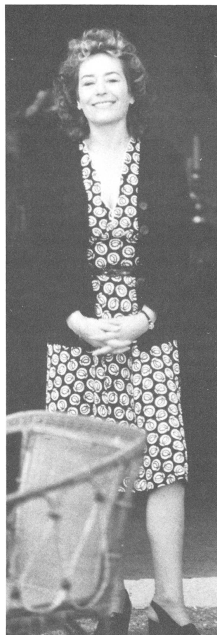
Annie Girardot als Hélène in «Partir, revenir».

Lelouch greift auf Stilmittel zurück, die sich in früheren Filmen bewährt haben. Seine Vorliebe für die freihändig geführte Kamera – sie zeichnet scheinbar die Bewegungen des Blickes nach und bekommt so fast absolute Subjektivität – behält er bei. Aber, mehr als auch schon, bleibt das nicht formale Spielerei, sondern will hautnah ans Geschehen heranführen. Solche Einstellungen signalisieren dramatische Zuspitzung bei Lelouch.