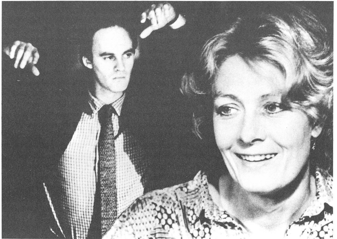
Vanessa Redgrave und Ian Holm in «Wetherby».

allein in einem abgeschiedenen Cottage lebt. Ihrer Umgebung drückt sie, bewusst oder unbewusst, den Stempel ihrer humanistischen Bildung auf, und diese Bildung verleiht ihrem Leben erst den tieferen Sinn. Auf jener Party, die sie eines Abends für ein paar ausgesuchte Freunde gibt, bemerkt ein für seinen Zynismus bekannter Kollege, nur die Bildung verhindere den Rückfall der Menschen in die Barbarei. Mit ungewohnter Heftigkeit widerspricht seine Frau: «Das Leben ist gefährlich, und manchmal gibt es nichts, was Du dagegen tun kannst!» Dem unvermittelt aufgebrochenen Ehezwist lauscht ein unscheinbarer, offensichtlich mit Jeans Freunden hergekommener junger Mann mit gespannter Aufmerksamkeit. Etwas später anbietet der zurückhaltend höfliche Gast seiner Gastgeberin, das leck gewordene Hausdach zu reparieren. Schon am nächsten Morgen steht er erneut vor Jeans Haustüre, lässt sich zu einer Tasse Tee hereinbitten und eröffnet Unfassliches: Niemand