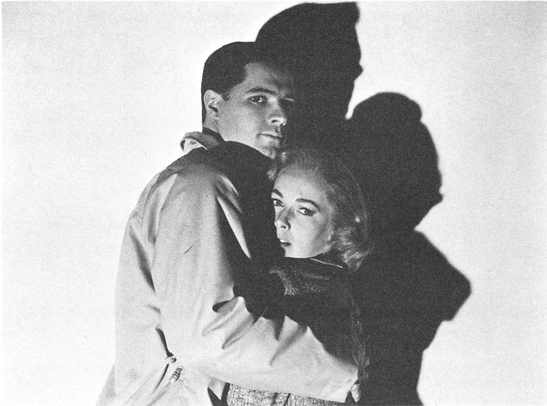
Subtilität der angsterzeugenden, filmischen Mittel: John Gavin und Janet Leigh in «Psycho» von Alfred Hitchcock.

technisch immer noch brillant gemachtes Melodram vorstellt, in dem Kong die einzige Figur ist, mit der wir uns identifizieren können.