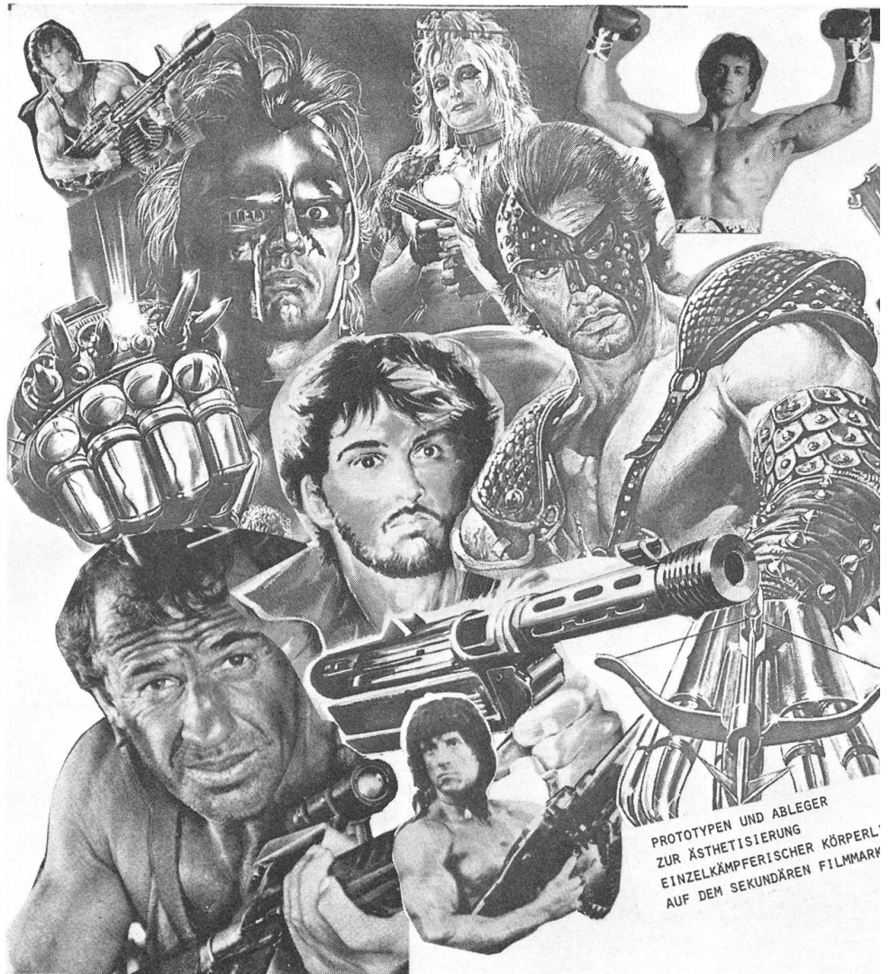
PROTOTYPEN UND ABLEGER ZUR ÄSTHETISIERUNG EINZELKÄMPFERISCHER KÖRPERL' AUF DEM SEKUNDÄREN FILMMARKT

Dies schloss und schliesst nicht aus, dass zum Beispiel das Horror-Genre auch durchaus reaktiv gesellschaftliche Zu- und Missstände artikuliert: etwa die Zerstörung der Familie, die in zahlreichen Exemplaren als physische Vernichtung mit grausamen Ausmassen thematisiert wird, oder die Auswüchse einer zunehmend durchtechnisierten inhumanen Medizin, als deren