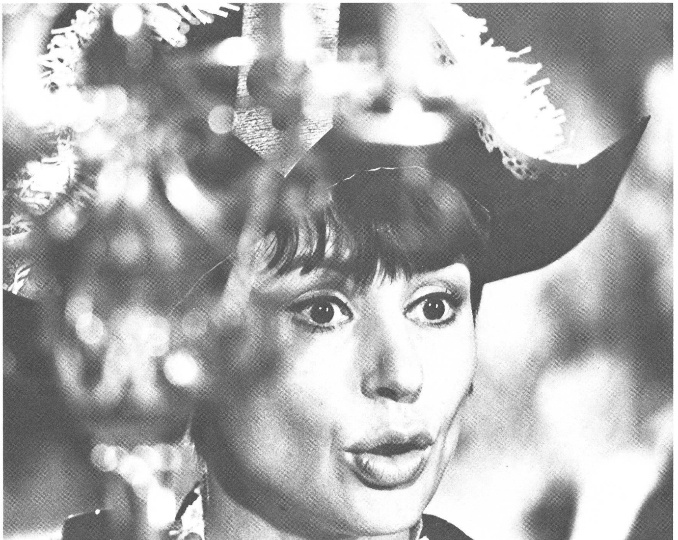
Harriet Andersson in «Flickorna».

sere wie auch innere Schwierigkeiten überwinden und teilhaben an der Verbesserung der Verhältnisse in dieser Welt. Der Fortschritt ist nicht für morgen, wie viele 1968 gehofft haben. Wir können Gewohnheiten und Gefühle, das Erbe einer jahrhundertalten Tradition nicht einfach ablegen. Die Veränderung geschieht in kleinen Schritten. Aber sie kommt, davon bin ich überzeugt.