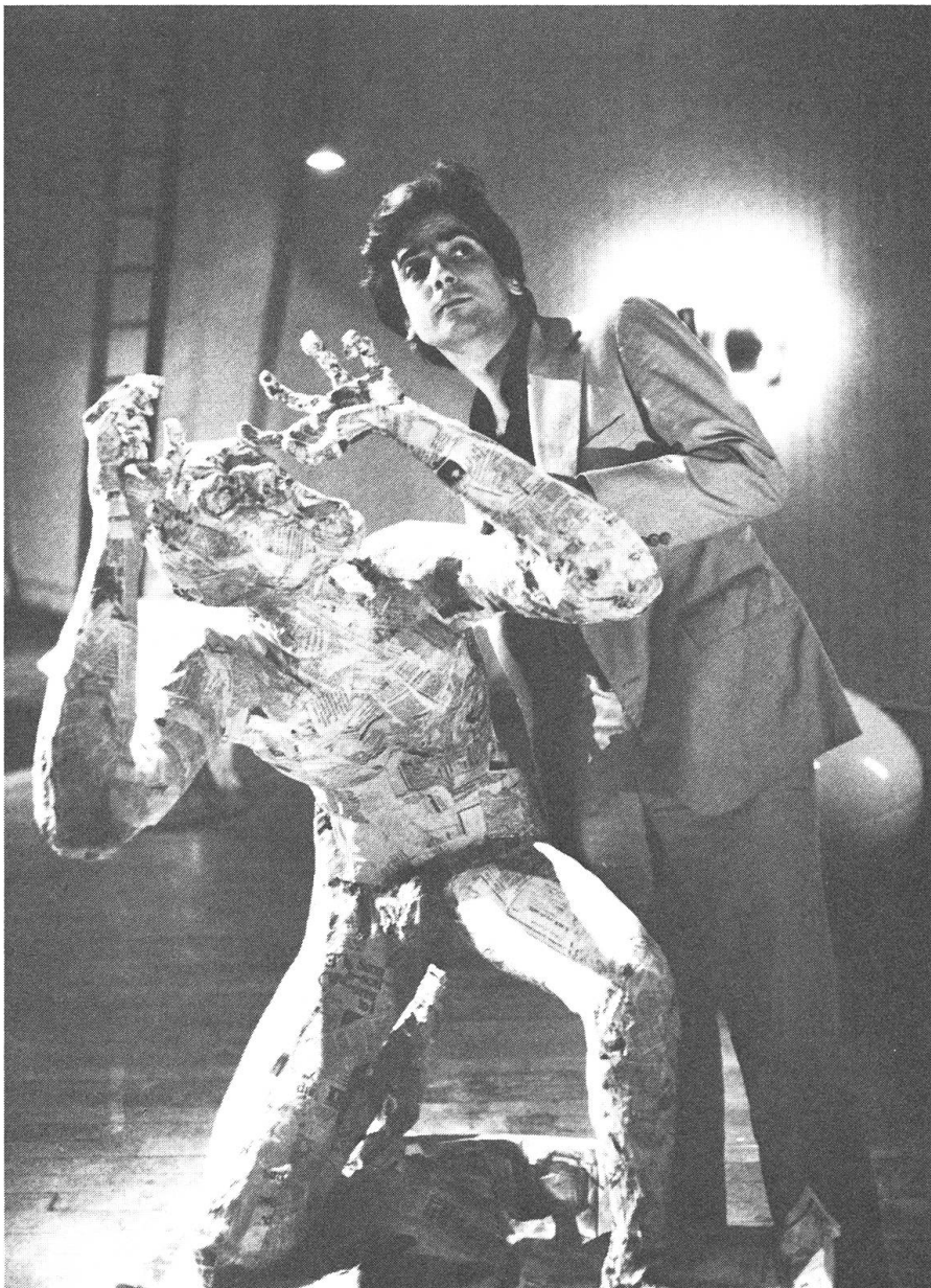
Giffin Dune als kleiner Angestellter, den es in einer regnerischen Vollmondnacht nach Soho verschlagt.

Und gerade an diesem Ort dann, der Weltgeschichte zitiert, wird Pauls wundersame, unglaubliche Rettung aus den Fangen des Gottseibeius durch die ewige Kunst eingeleitet. Er wird nicht etwa zum Kunstwerk erklart, sondern zu einem solchen gemacht! Aber nicht, bevor er nicht auf die Knie gesunken und verzweifelt ausgerufen hat: Warum tust Du mir das an, womit habe ich das bloss verdient? Und nicht, bevor er nicht seiner Knstlerin begegnet ist, die ihn verkunstwerken wird, und von ihr gehrt hat, was den ganzen Film zusammenfasst: «Why are you doing