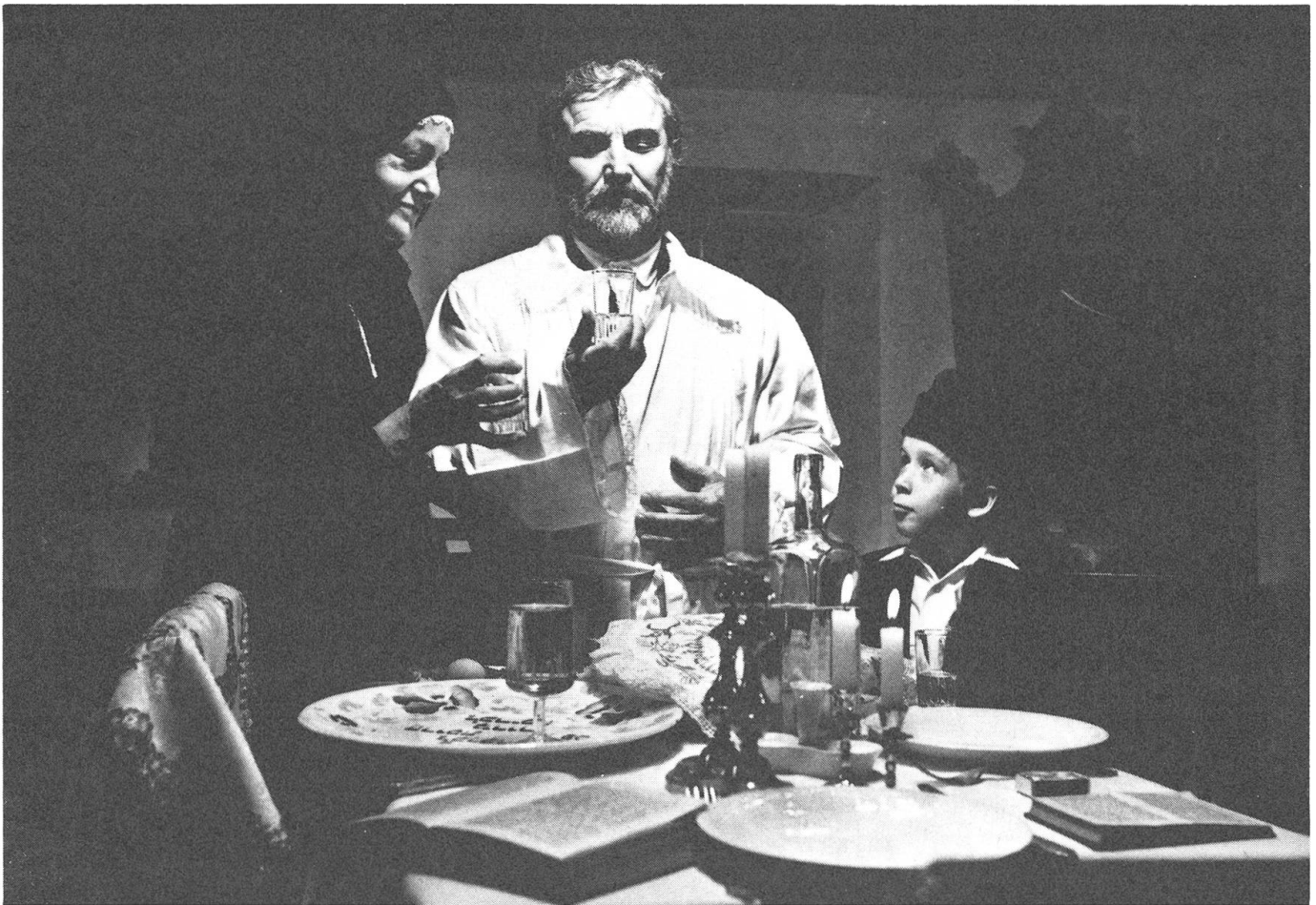
«Jób lázadáza» (Hiobs Revolte) von Imre Gyöngyössi und Barna Kabay.

Gleichzeitig ist er aber auch ein heimatloser Mensch, der nicht Jude sein darf in jenem entsetzlichen Moment, da sie die Juden im Dorf wie Vieh zusammentreiben, obwohl er sich doch in seinem Innersten als ihrsgleichen fühlt.