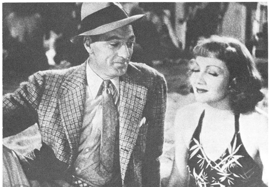
Claudette Colbert und Gary Copper.

spiel lebt vom so typischen Lubitsch-Touch: Der Zuschauer ist quasi in die Handlung einberechnet, ist ein Faktor derselben (Truffaut). Lubitsch spielt mit den Vorstellungen des Betrachters. Dieser muss kombinieren, assoziieren und die einzelnen Handlungsmomente integrieren. Die Komik der Gags resultiert aus einem Zusammenspiel verschiedener Komponenten: Situationskomik, Dialoge, Geräusche, Mimik und musikalische Untermalung. Wesentliche Elemente aus dem Stummfilm bleiben auch hier wichtig. Keine dieser Komponenten hat für sich isoliert eine nur annähernd so komische Wirkung. Wird der Gag vereinzelt nur auf den Dialog abgestellt – hier glaubte ich die Handschrift Wilders zu erkennen – wirkt dieser oft konstruiert und blöd. Die einzelnen Gags stehen bei Lubitsch in einem Handlungszusammenhang, greifen ineinander und nehmen aufeinander Bezug. Anders als beispielsweise in «Trouble in Paradise» (1932) fehlt der Handlung der Komödie eine gewisse Spannung. Dies mag mitunter auch an der grundsätzlichen Schwierigkeit liegen, Bühnenstücke für den Film zu adaptieren. ■