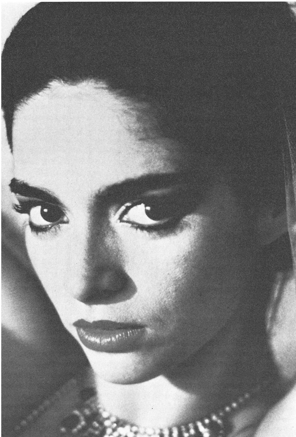
Claudia Ohana in «Opera do Malandro» von Ruy Guerra.

fängnisses nach Wasser und Nahrung schreien.