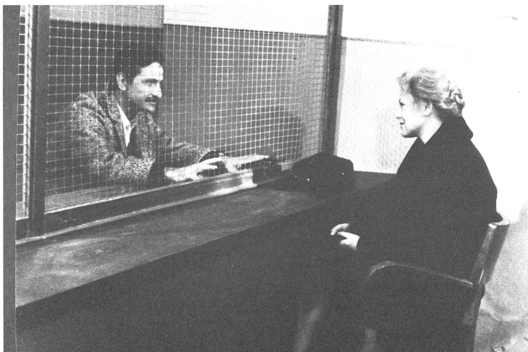
Virna Lisi und Vittorio Mezzogiorno im italienischen Serien-Opus «... und das Leben geht weiter», das zur Zeit in ARD und ORF 2 zu sehen ist.