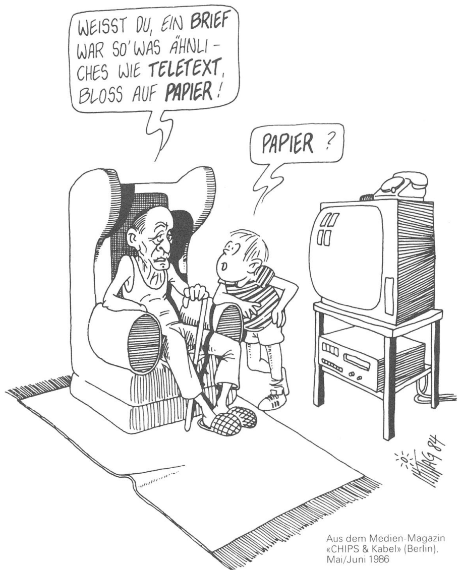
Aus dem Medien-Magazin «CHIPS & Kabel» (Berlin), Mai/Juni 1986

Telidon hat trotz der zu Beginn starken Förderung durch den Staat alle optimistischen Prognosen Lügen gestraft. Einer der Gründe ist die allen Videotex-Systemen gemeinsame Zielsetzung, informatisierte Kommunikationsvorgänge in den Privathaushalten heimisch zu machen. Offensichtlich ist aber das Bedürfnis nicht sehr gross, Bankgeschäfte, Einkäufe, Ferienbuchungen und anderes mehr zuhause am Bildschirm abzuwickeln. Ein paralleles Phänomen ist das der privaten Benutzung von Mikrocomputern. Dazu gibt es eine Untersuchung der Universität Montreal. 1983 war in Kanada der Boom der Home- oder Mikrocomputer auf einem Höhepunkt. 880 Käufer solcher Geräte wurden damals und zwei Jahre später wieder befragt. Die Ergebnisse zeigten, dass nur die berufsbezogene Nutzung der Kleincomputer die erste Neugierphase überdauerte. Vereinzelt Versuche, die