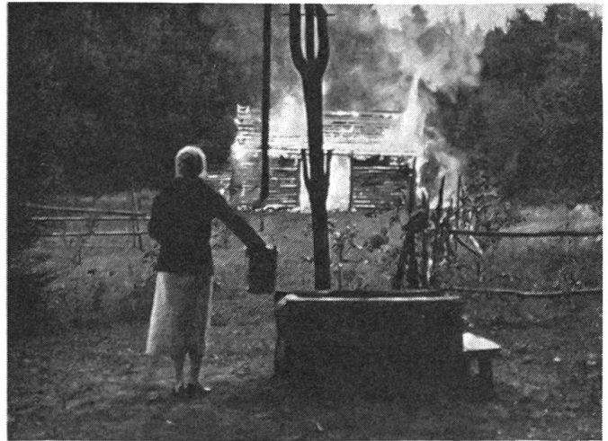
Aus «Die versiegelte Zeit»