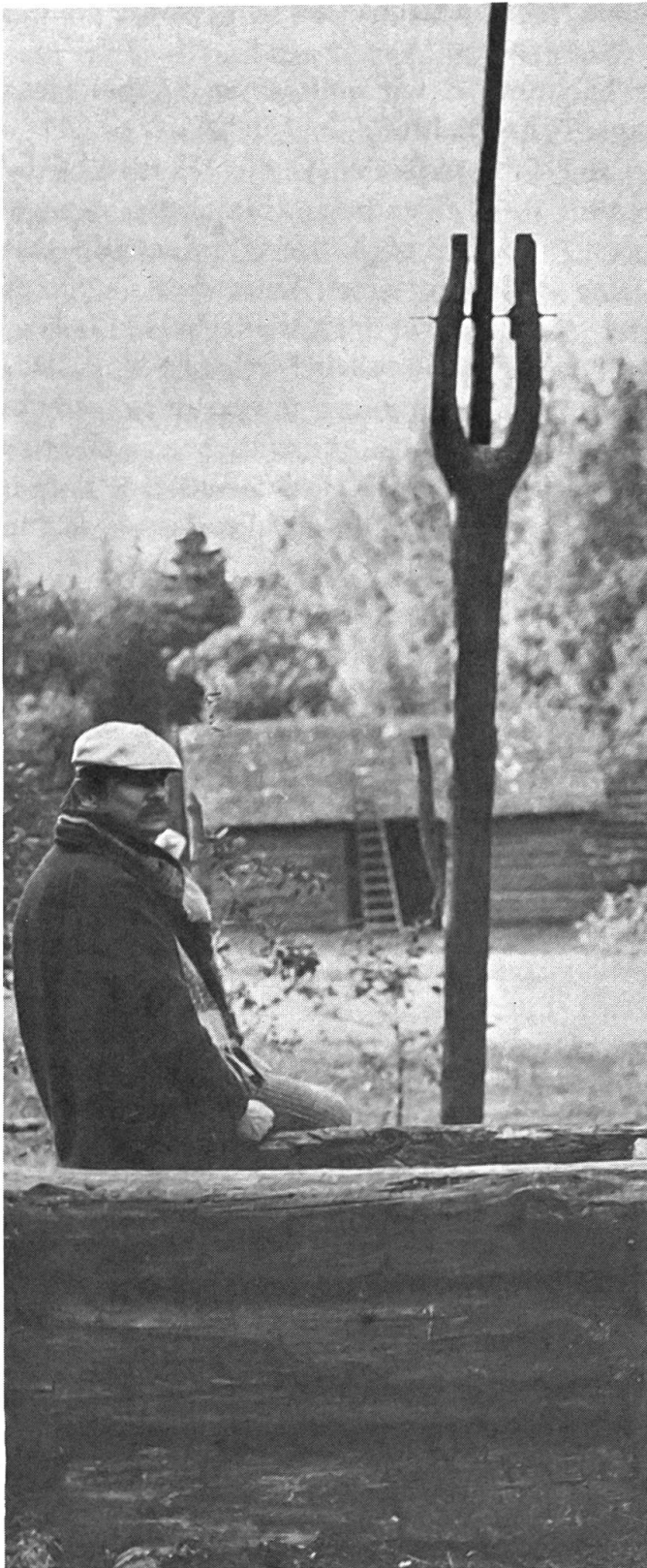
«Der Spiegel»: Tarkowskij am Drehort des Brandes. Montagesequenz aus der Brandszene.