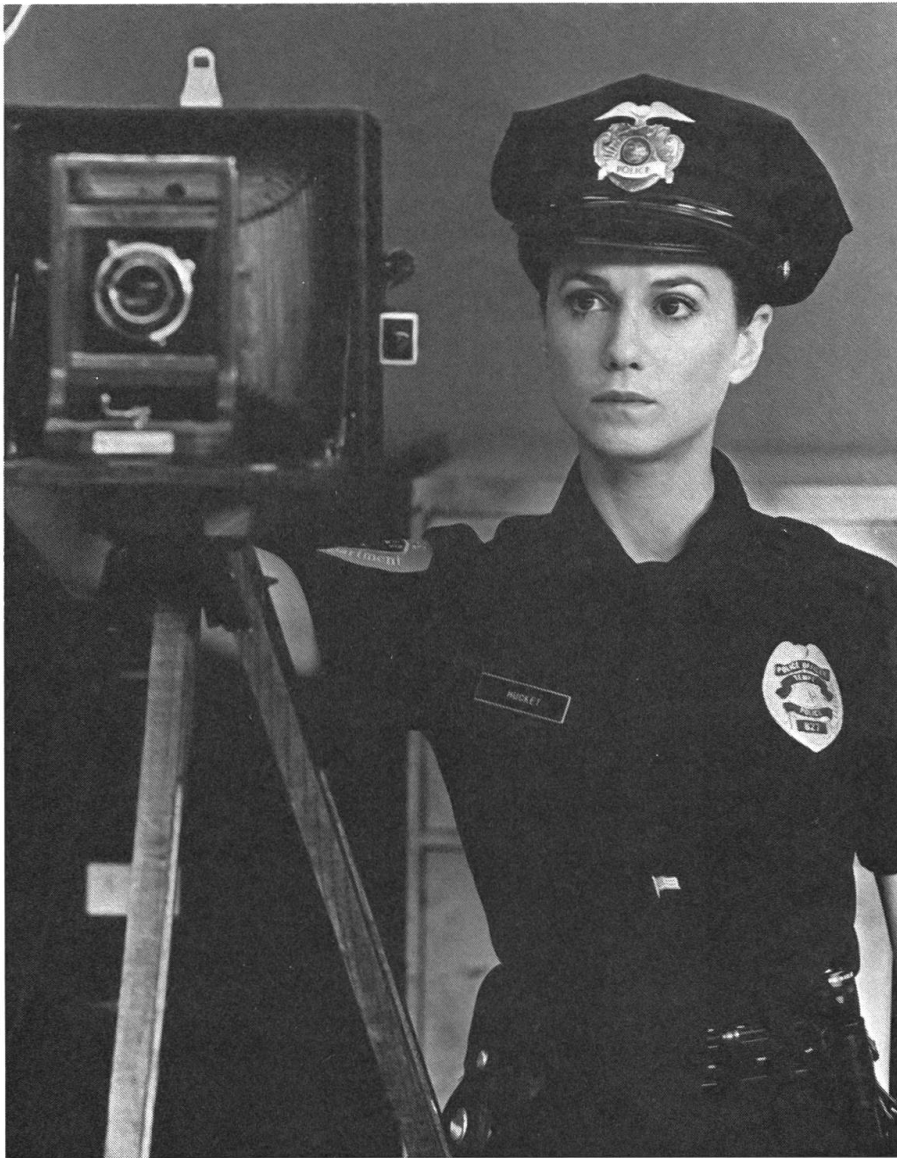
Nicolas Cage als kleiner Gauner H. I. und Holly Hunter als ehemalige Polizeibeamtin Ed bilden zusammen ein rührseliges Paar. Die Bestandteile des amerikanischen Traums werden gekauft oder geklaut: so auch ein Kind.

heimsuchen, dem süßen Kindersegen auf die Schliche kommen und das Baby für ihren Zweck entführen. Den Haussegen total schief hängen Glen, H. I.'s doofer Vorgesetzter, und seine Frau Dot, deren Polenwitze, Tips und Fragen (Dot zu Ed: «Ich hatte bei meinen Kindern solche Schmerzen, wie hast du Nathan gekriegt?») nach einem rasant-brachialen Showdown aller Beteiligten sogar die Polizei kurz aus dem Konzept bringen.