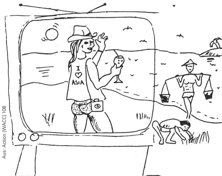
Aus: Action (WACC) 108

Kommunikation, die befreit, ermöglicht den Leuten ihre eigenen Bedürfnisse auszusprechen und hilft ihnen, gemeinsam diese Bedürfnisse zu be-