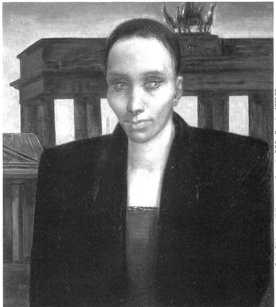
Beide Bilder aus «X. Kunstausstellung der DDR», Dresden 1987/88