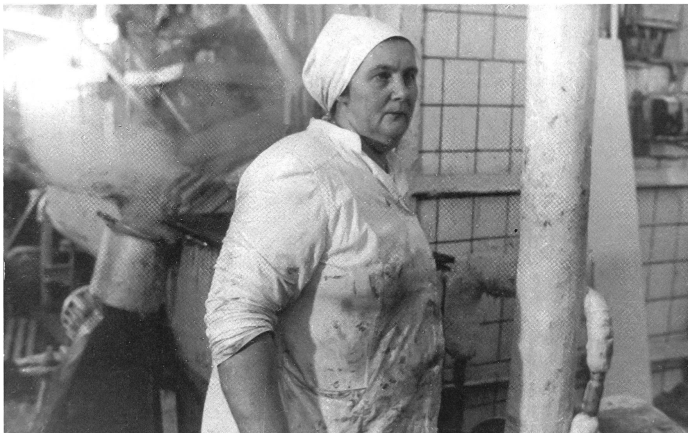
Farce auf idealisierende Epen über Helden der Planerfüllung: «Skoro leto» (Bald kommt der Sommer) von P. Kogan.

kunft die einzelnen Studios der Unionsrepubliken für die Entscheidung zuständig, welche Drehbücher verfilmt werden sollen, sowie für die Abnahme der fertiggestellten Filme. Nach dem neuen Prinzip der wirtschaftlichen Rechnungsführung würden die regionalen Studios auch die wirtschaftlichen Folgen ihrer Entscheidungen zu tragen haben. Auf die skeptischen Fragen westlicher Journalisten, die aus eigenen schlechten Erfahrungen davor warnten, den Dokumentarfilm einfach dem (Kino-)Markt auszuliefern, gab der oberste sowjetische Filmminister eher ausweichende Antworten.