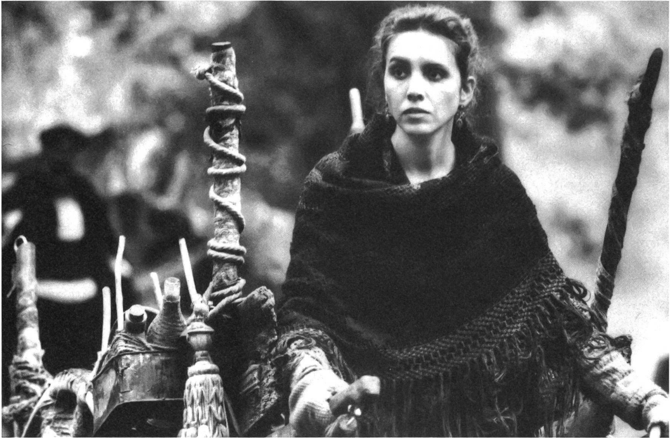
Ana Belén in «Divinas palabras» von Jose Luis Garcia Sánchez.