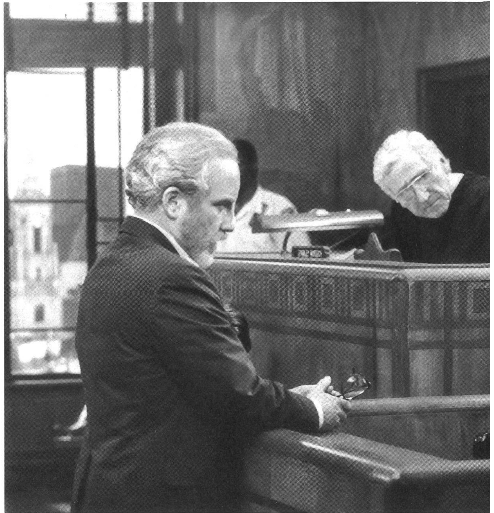
Kampf um Menschenwürde vor Gericht: Barbra Streisand in «Nuts» von Martin Ritt.

Ihr renitentes Verhalten fordert das System heraus. Für Menschen wie Claudia ist die Irrenanstalt gerade der richtige Ort. Doch die streitbare Frau fühlt sich im Recht; sang- und klanglos will sie sich nicht versorgen lassen. Zunächst geht es ihr darum, ernst genommen zu