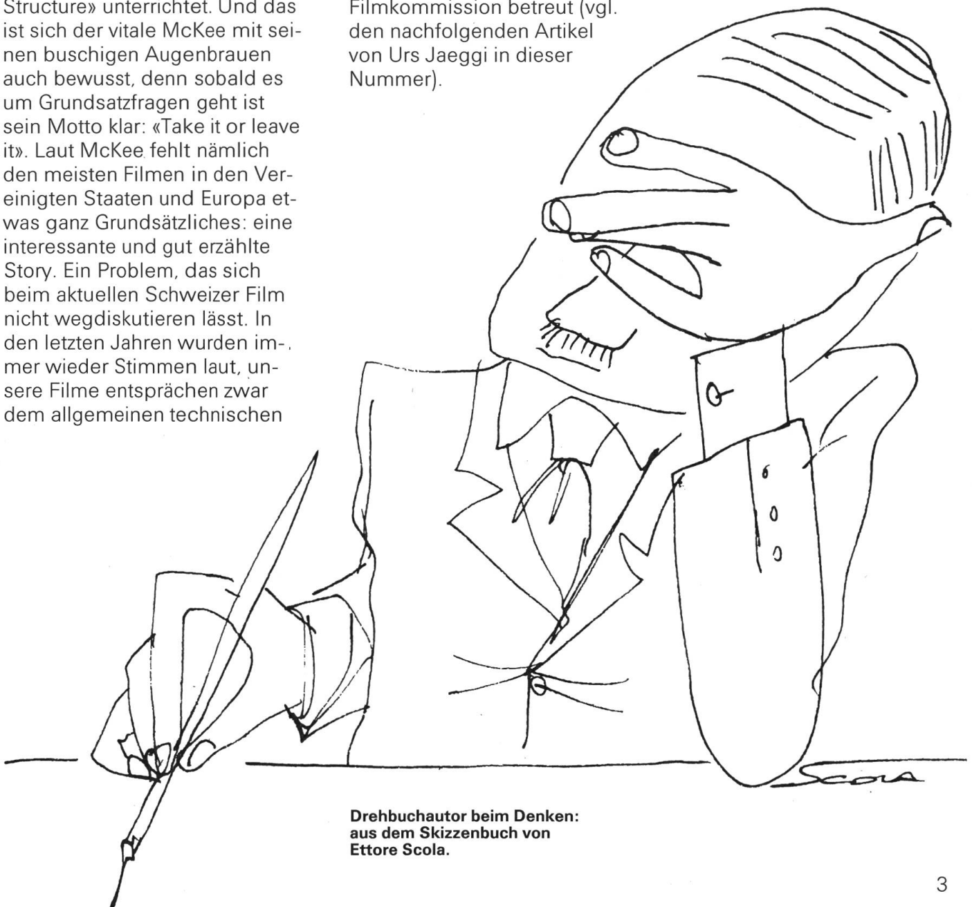
Drehbuchautor beim Denken: aus dem Skizzenbuch von Ettore Scola.